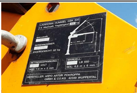
Ansicht Typschild Ladekran