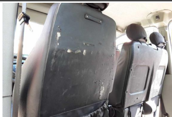
Lehnenbezug vorne links gerissen