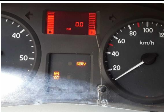
Kombi-Instrument Scheibe gerissen