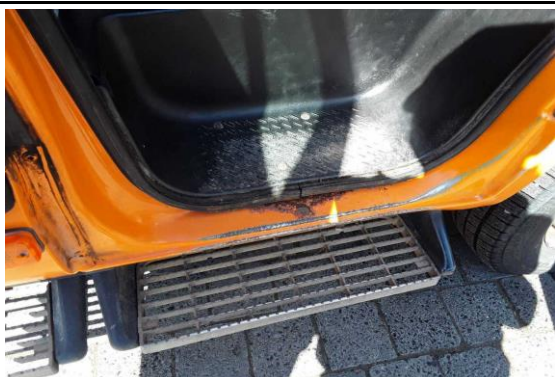
Schweller / Einstiege links und rechts korrodiert