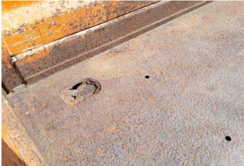
Ladeboden stark korrodiert