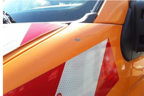
Kotflügel links Verschärft