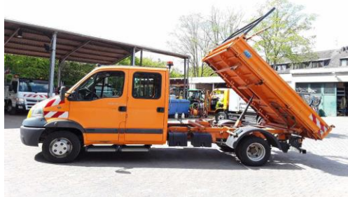
Ansicht Kipper angehoben