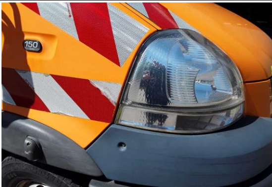
Scheinwerger rechts gerissen