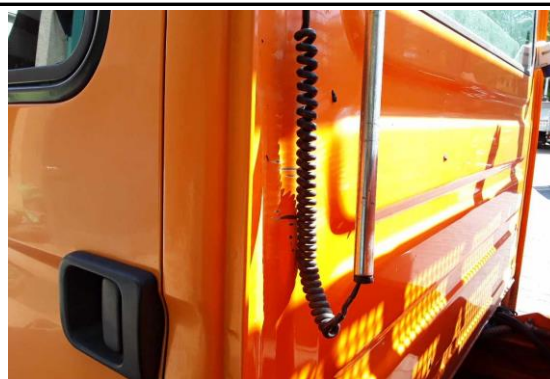
Rückwand Fahrerhaus verschürft, Korrosion