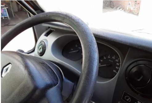
Lenkradummantelung starke Abnutzung