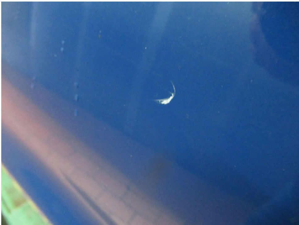
Bild 6 : Kotflügel vorne rechts Lackierung, zerkratzt, lackieren mit Lackaufbau