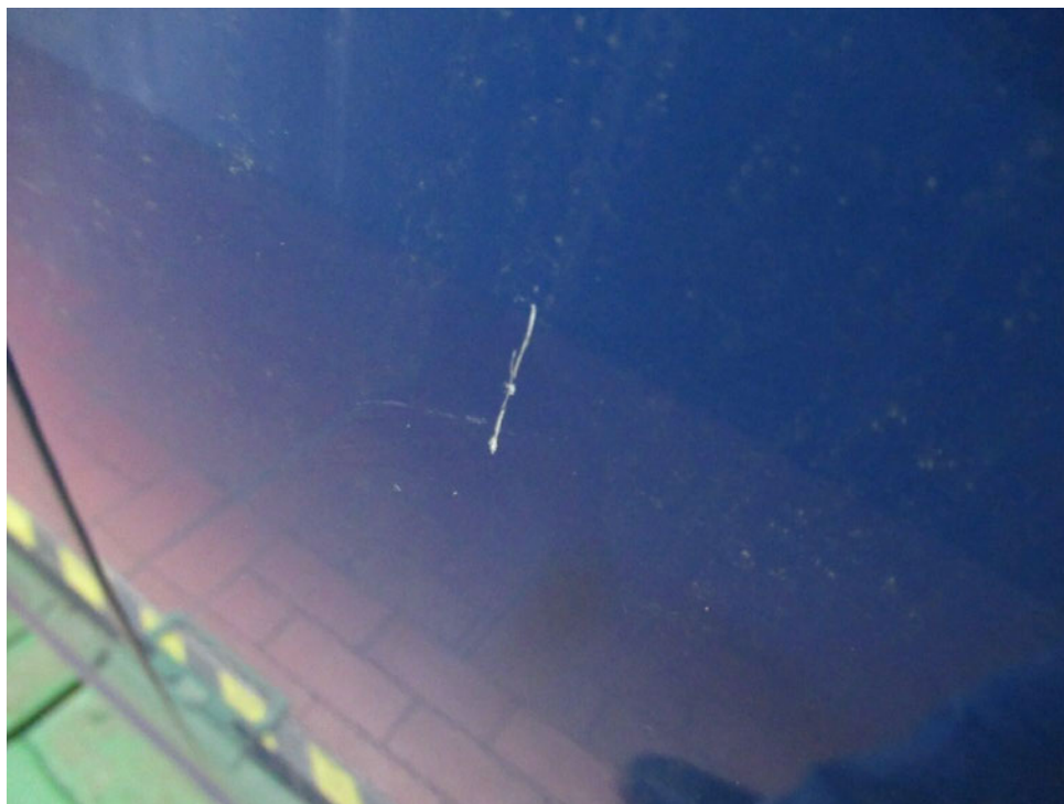
Bild 7 : Tür vorne rechts Lackierung, zerkratzt, lackieren mit Lackaufbau