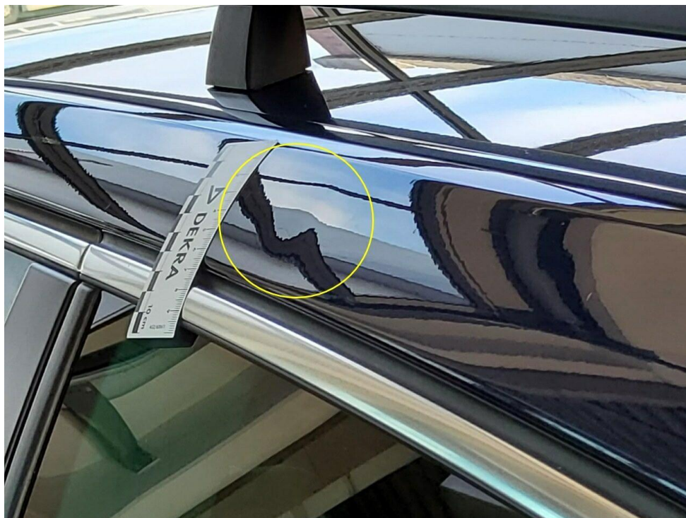
Bild 5 : Dachrahmen links, deformiert, instandsetzen und lackieren mit Lackaufbau