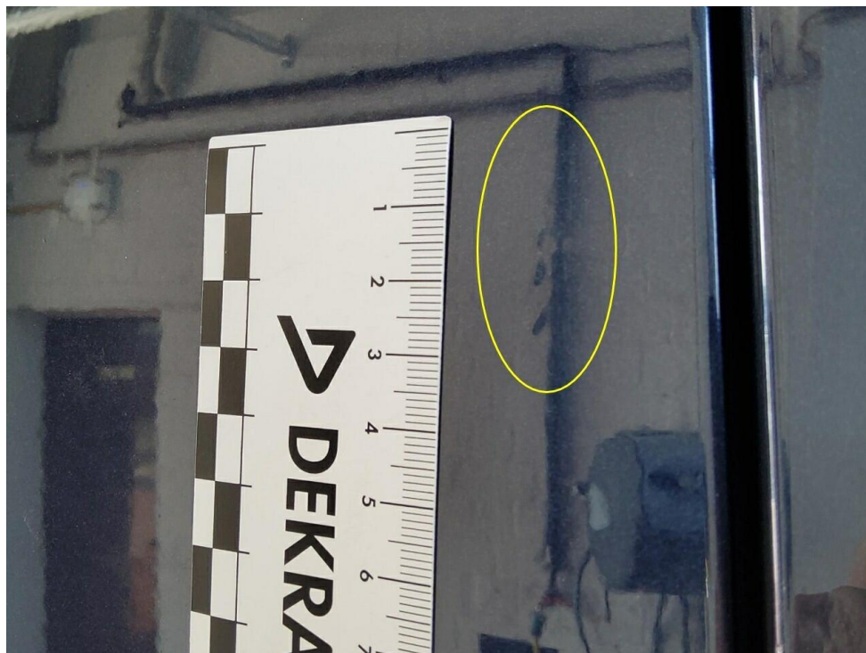
Bild 9 : Tür hinten rechts Lackierung, Umweltschaden, lackieren mit Lackaufbau