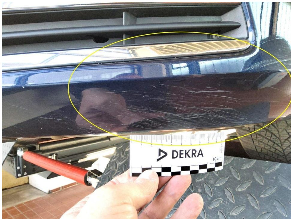
Bild 8 : Stoßfänger vorne Lackierung, zerkratzt, lackieren mit Lackaufbau