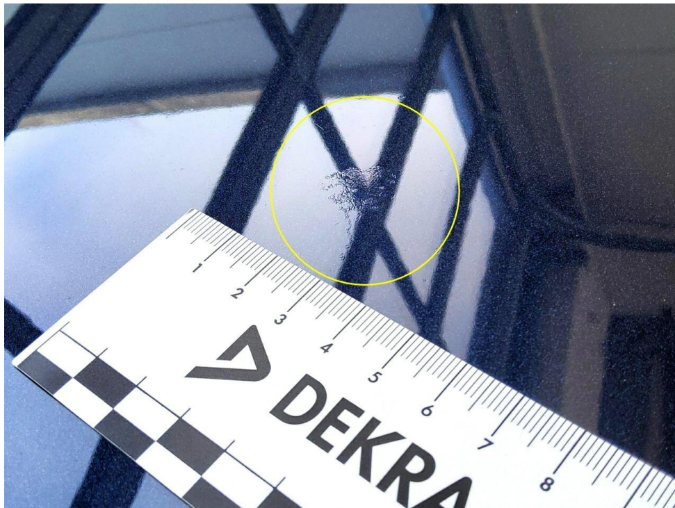
Bild 7 : Motorhaube Lackierung, Umweltschaden, lackieren mit Lackaufbau