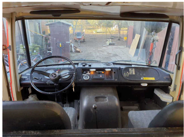
Abbildung 4: Kombiinstrument