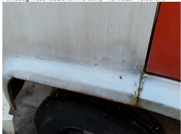
Beschadigung 4: Karosserie: Karosserie (und Korrosion. Fahrzeug muss restauriert werden!) - verkratzt / verschurft -