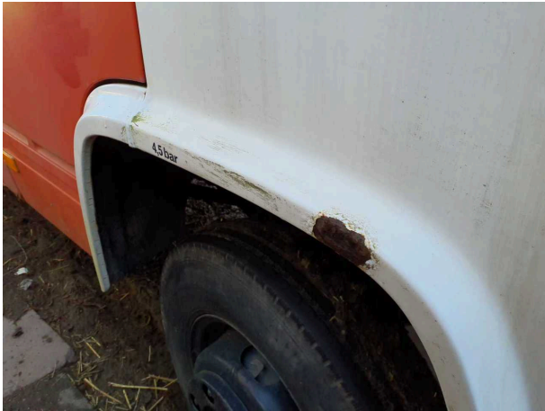
Beschädigung 4: Karosserie: Karosserie (und Korrosion. Fahrzeug muss restauriert werden!) - verkratzt / verschürft -