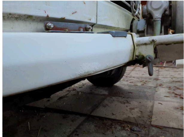
Beschädigung 4: Karosserie: Karosserie (und Korrosion. Fahrzeug muss restauriert werden!) - verkratzt / verschürft -