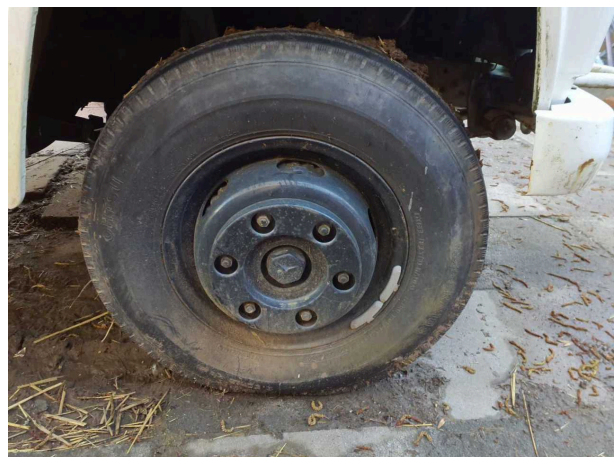
Abbildung 10: Sonstiges