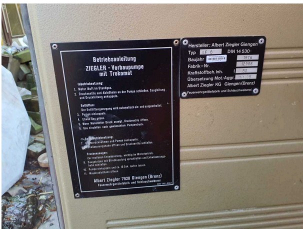
Abbildung 11: Sonstiges