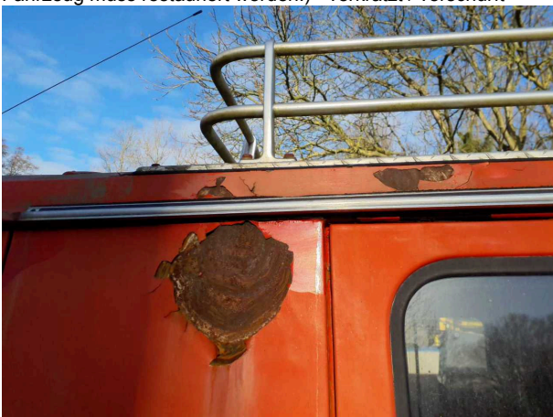
Beschadigung 4: Karosserie: Karosserie (und Korrosion. Fahrzeug muss restauriert werden!) - verkratzt / verschurft -