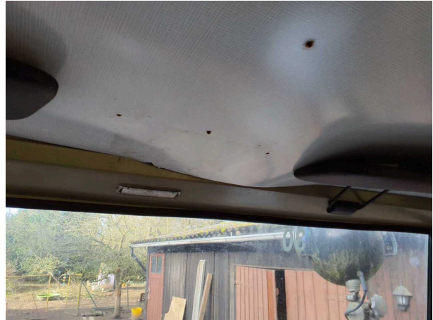
Beschadigung 2: Interieur: Innenraum - verkratzt / verschurft - Wertminderung