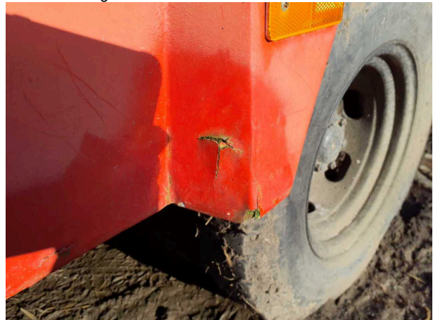
Beschadigung 4: Karosserie: Karosserie (und Korrosion. Fahrzeug muss restauriert werden!) - verkratzt / verschurft -