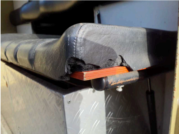
Beschadigung 2: Interieur: Innenraum - verkratzt / verschurft - Wertminderung