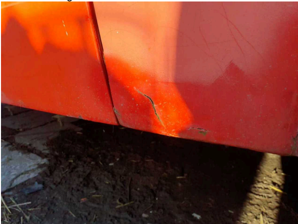
Beschadigung 4: Karosserie: Karosserie (und Korrosion. Fahrzeug muss restauriert werden!) - verkratzt / verschurft -