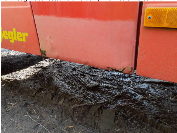
Beschädigung 4: Karosserie: Karosserie (und Korrosion. Fahrzeug muss restauriert werden!) - verkratzt / verschürft -