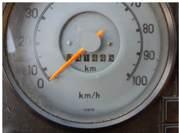
Abbildung 6: Kombiinstrument