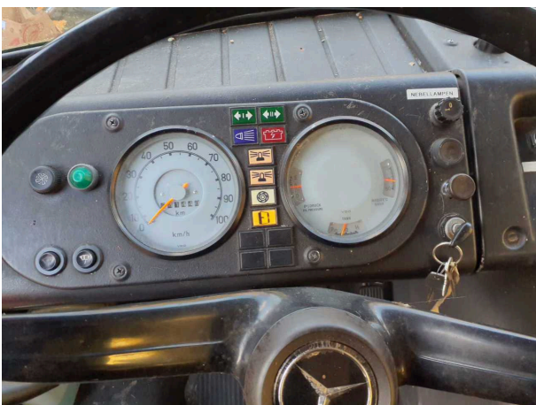
Abbildung 5: Kombiinstrument