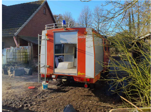
Abbildung 2: Schräg hinten