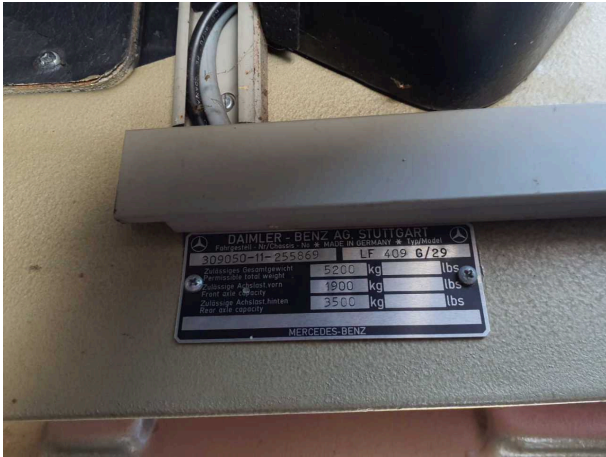
Abbildung 7: FIN