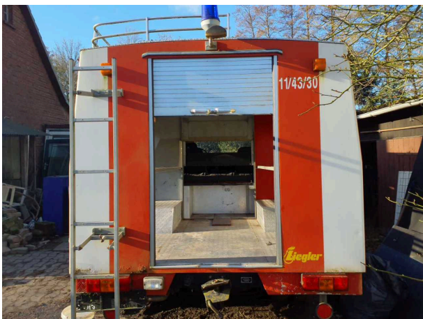
Abbildung 9: Laderaum