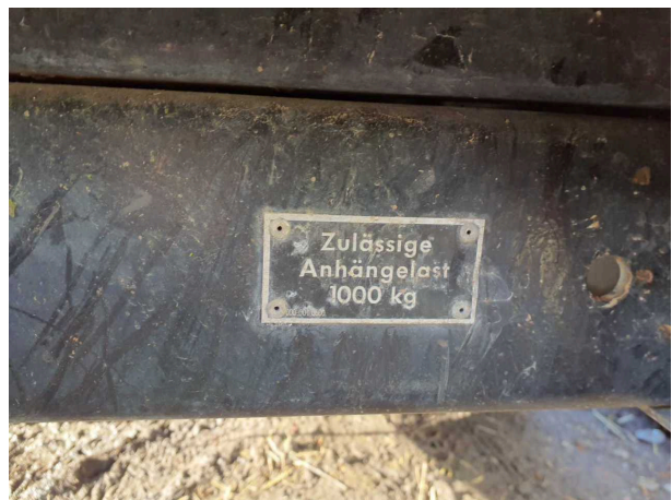
Abbildung 12: Sonstiges