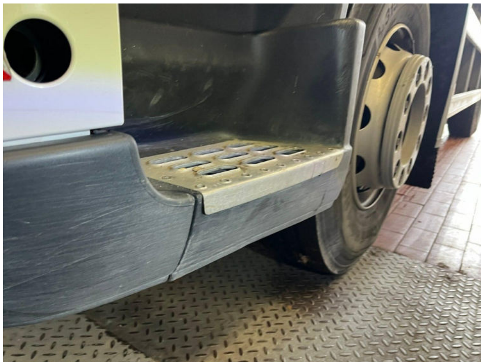
Bild 16 : Stoßfängerecke vorne links und Einstieg unten verschrammt