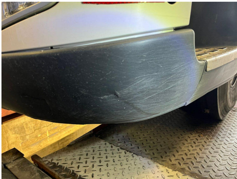
Bild 15 : Stoßfängerecke vorne links und Einstieg unten verschrammt