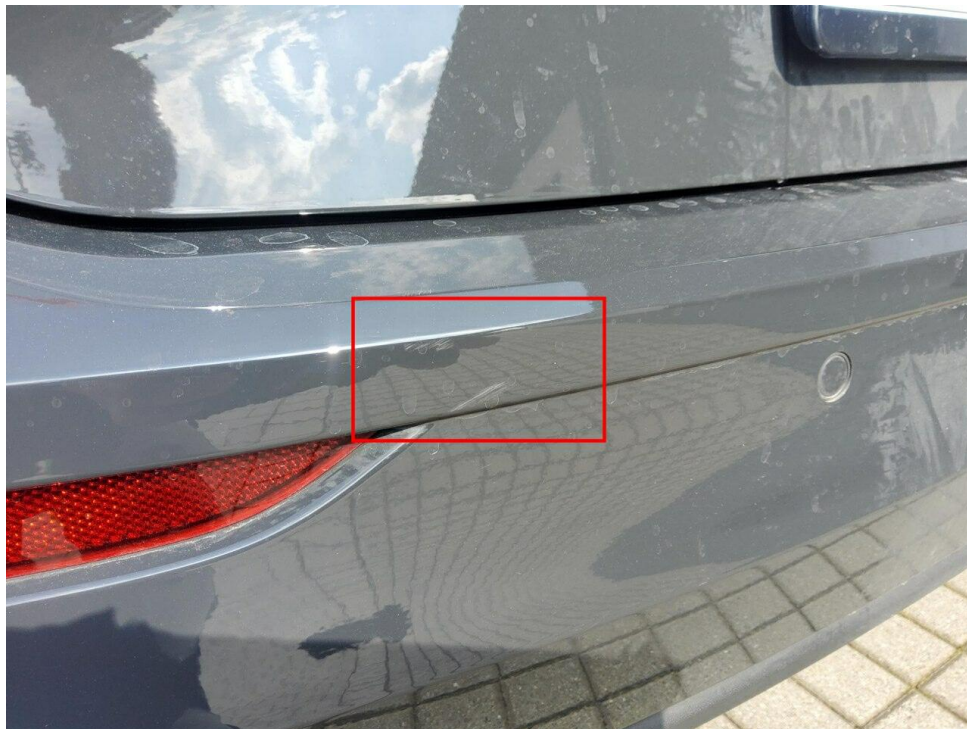
Bild 7 : Stoßfänger hinten Lackierung, fleckig, lackieren mit Lackaufbau