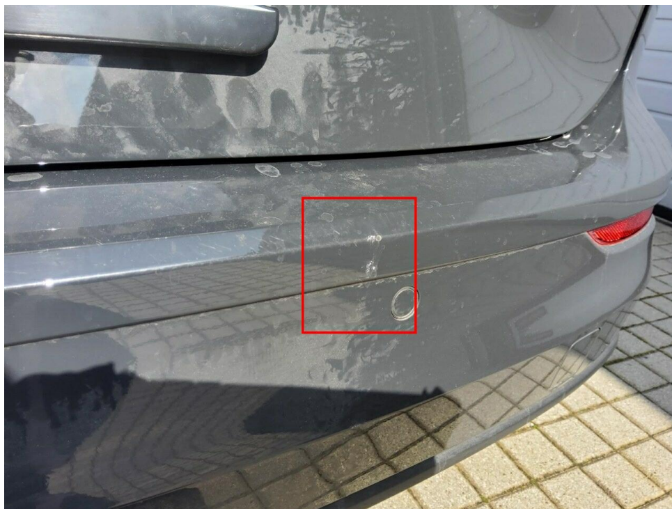
Bild 6 : Stoßfänger hinten Lackierung, fleckig, lackieren mit Lackaufbau