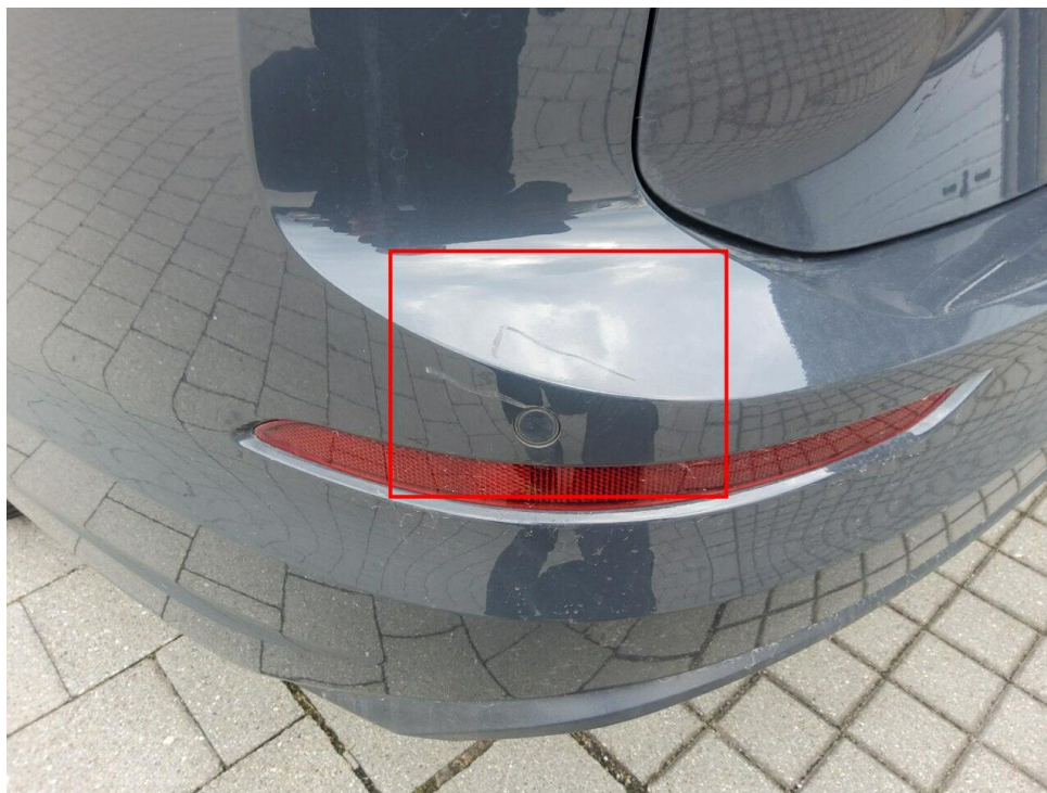
Bild 8 : Stoßfänger hinten Lackierung, verschrammt, lackieren mit Lackaufbau