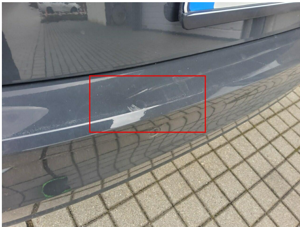
Bild 7 : Stoßfänger hinten Lackierung, verschrammt, lackieren mit Lackaufbau