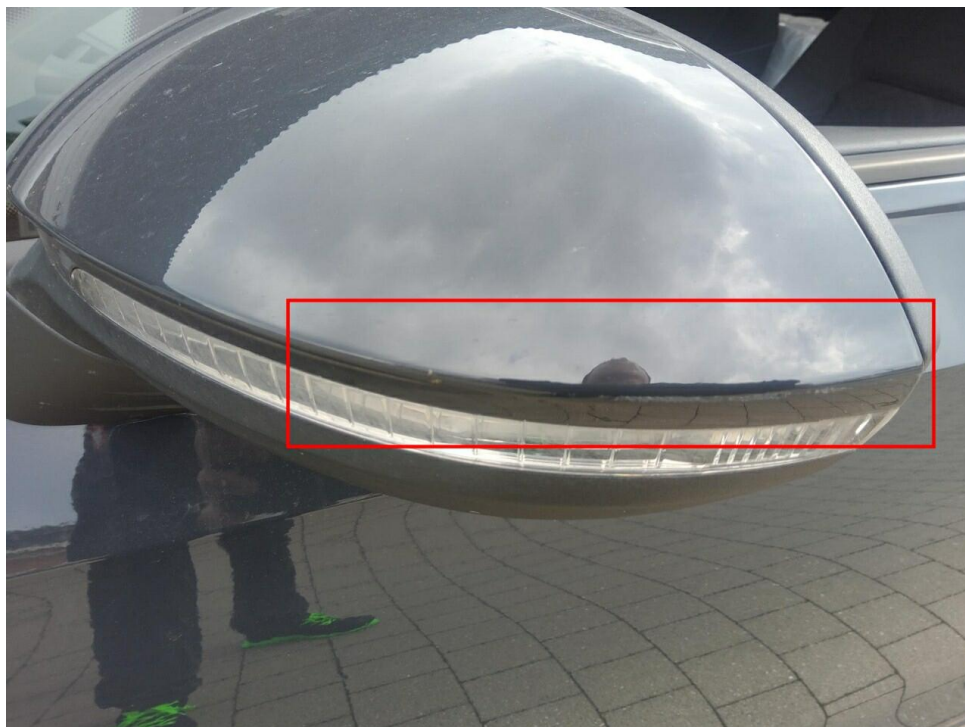
Bild 6 : Außenspiegel links Lackierung, zerkratzt, lackieren mit Lackaufbau