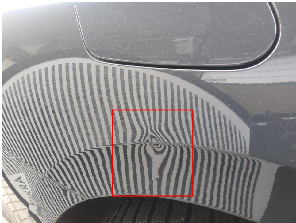
Bild 9 : Seitenteil hinten rechts, eingedellt, instandsetzen und lackieren mit Lackaufbau