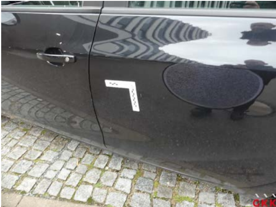
Bild 35 Tür hinten links, verkratzt, auslegen, schleifen, polieren