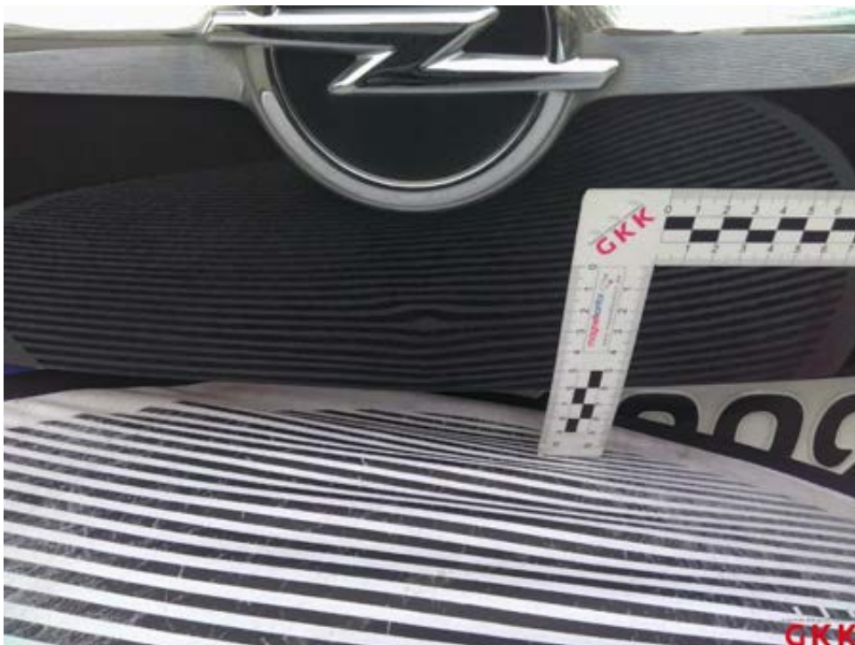
Bild 16 Heckklappe, bis 3 Dellen / Bauteil, kalt drücken