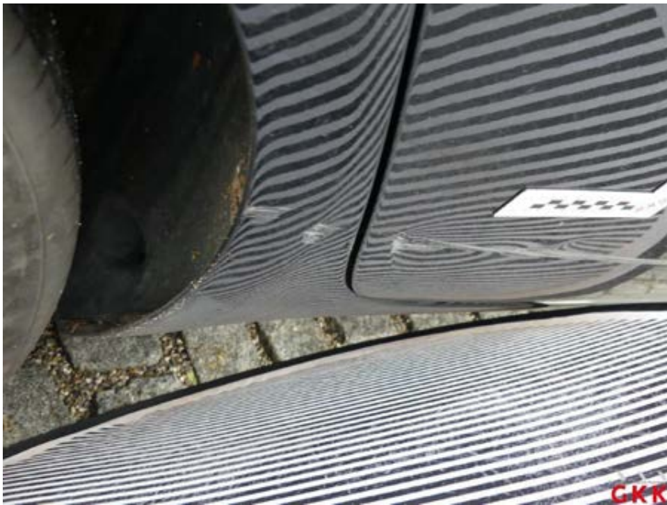
Bild 30 Seitenwand rechts, beschädigt, instand setzen - lackieren