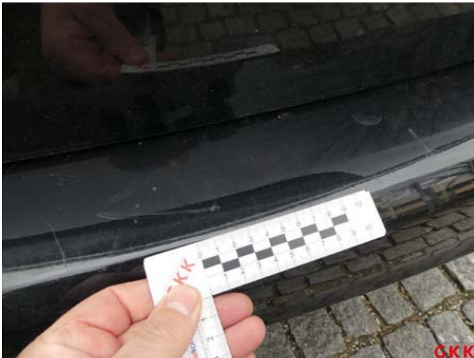
Bild 32 Stoßfänger hinten, Verkleidung -lackiert-, verkratzt, lackieren