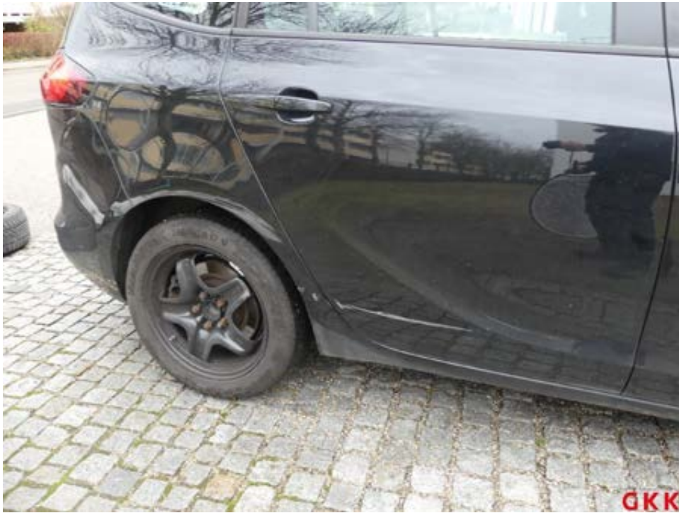
Bild 29 Seitenwand rechts, beschädigt, instand setzen - lackieren