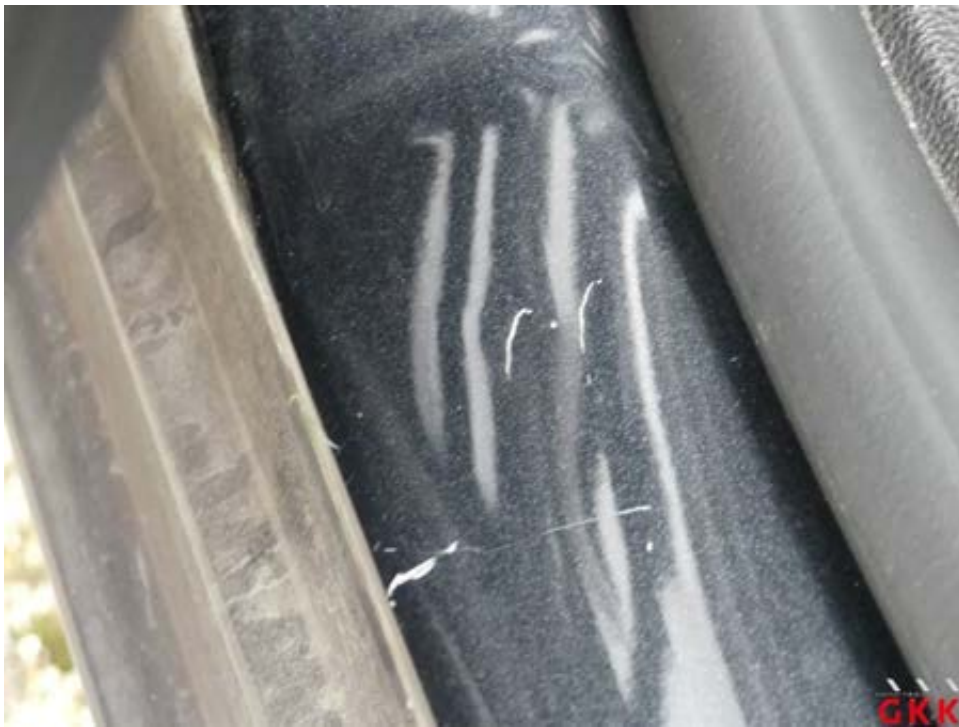
Bild 24 Einstieg hinten links eingedellt und verkratzt, Smartrepair