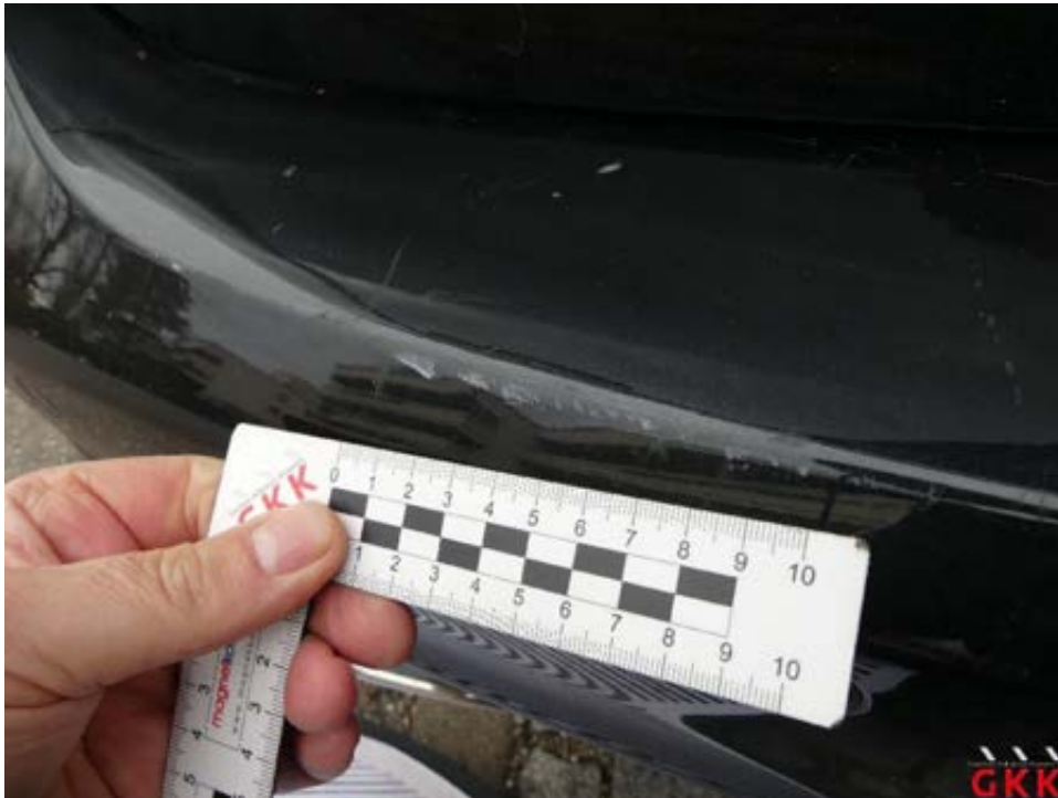
Bild 33 Stoßfänger hinten, Verkleidung -lackiert-, verkratzt, lackieren