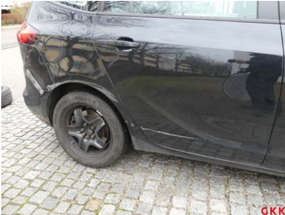
Bild 27 Tür hinten rechts, beschädigt, instand setzen - lackieren