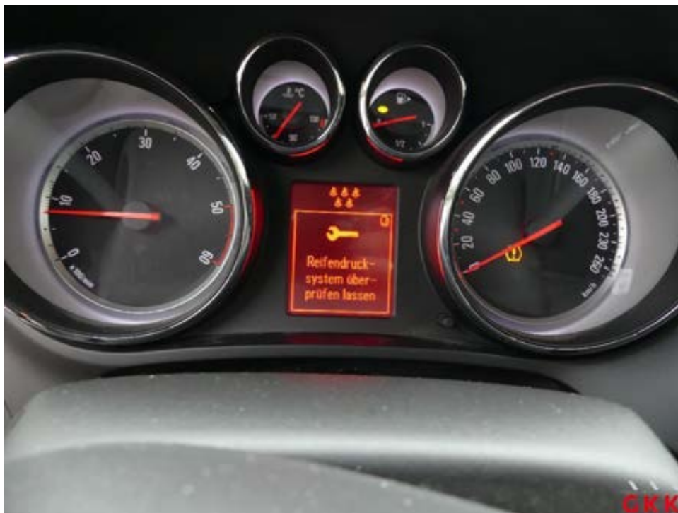
Bild 18 Reifen, Fehlerspeicher, aktiv, auslesen / prüfen