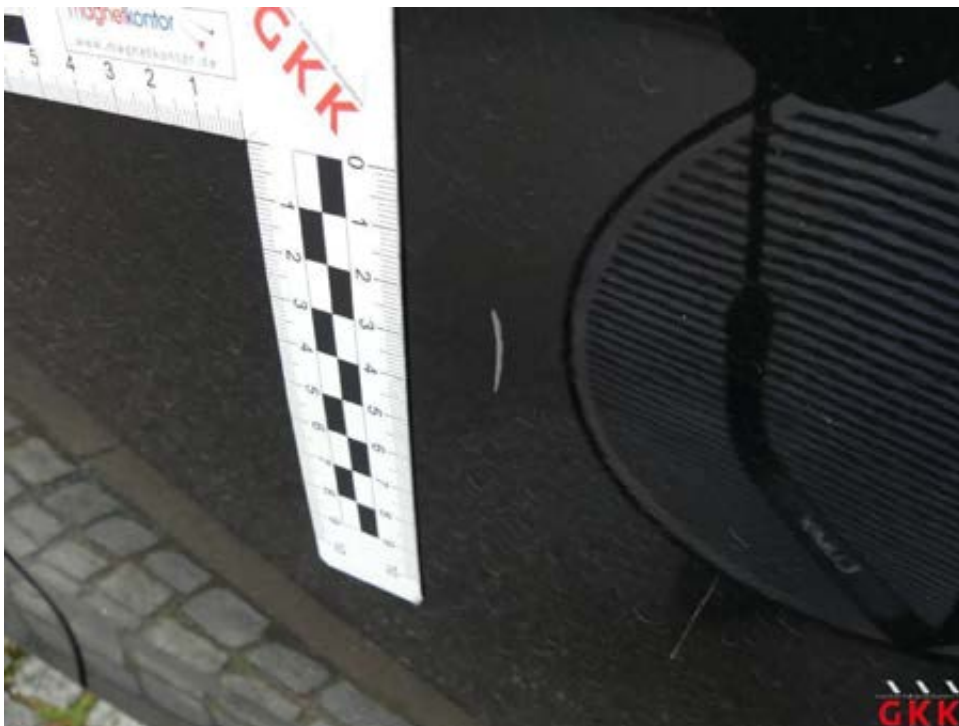
Bild 36 Tür hinten links, verkratzt, auslegen, schleifen, polieren