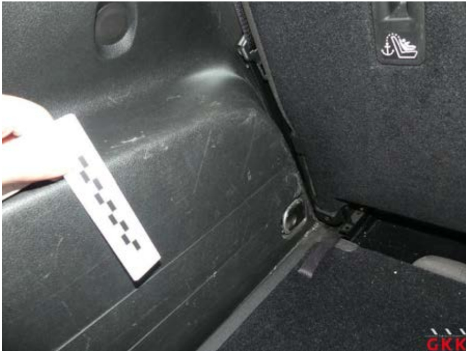
Bild 19 Laderaum, verkratzt, Smartrepair