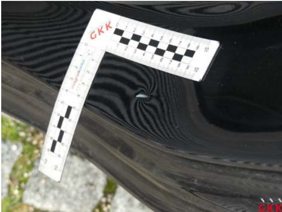
Bild 23 Einstieg hinten links eingedellt und verkratzt, Smartrepair