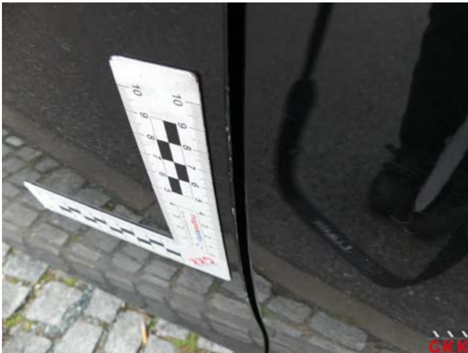
Bild 38 Tür vorne links, Kante, verkratzt, auslegen, schleifen, polieren