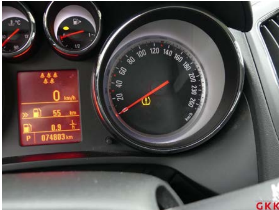
Bild 17 Reifen, Fehlerspeicher, aktiv, auslesen / prüfen