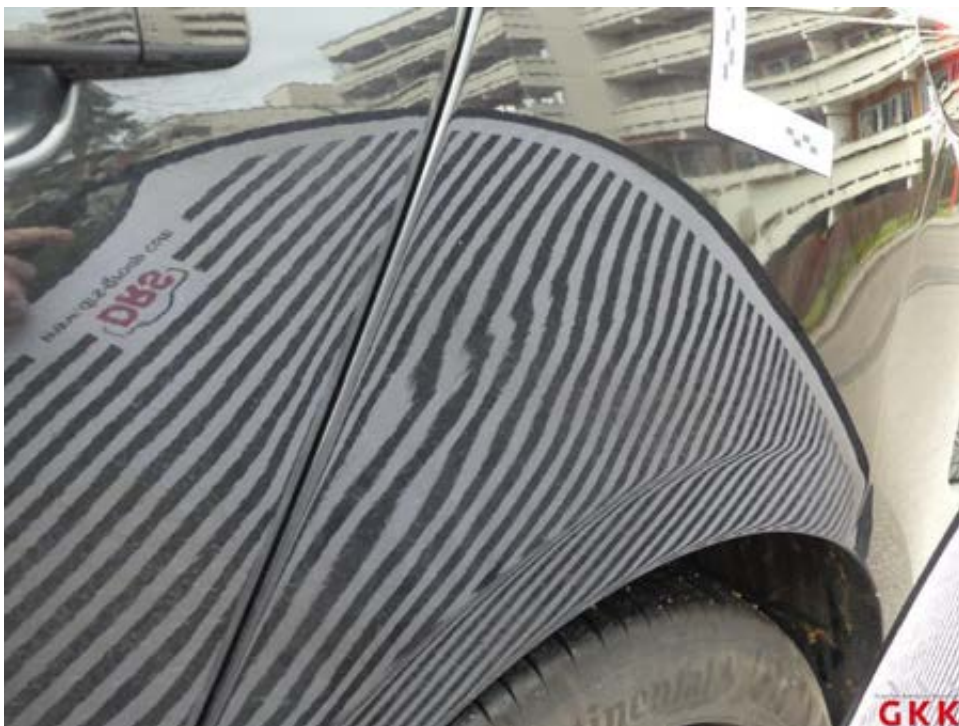
Bild 26 Seitenwand links, Reparaturmangel, lackieren