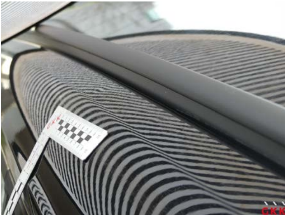
Bild 34 Dach, Holm links, beschädigt, kalt drücken