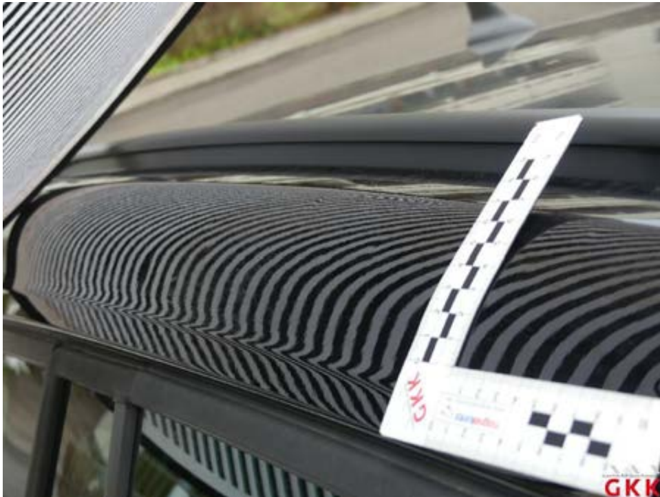
Bild 31 Dach, Holm rechts, beschädigt, kalt drücken