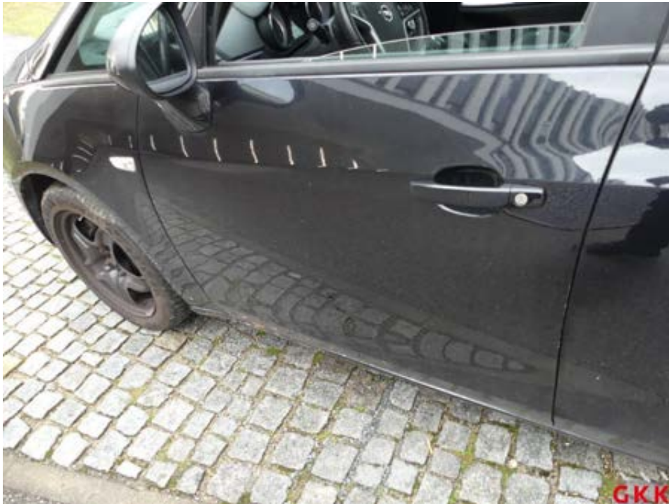
Bild 37 Tür vorne links, Kante, verkratzt, auslegen, schleifen, polieren