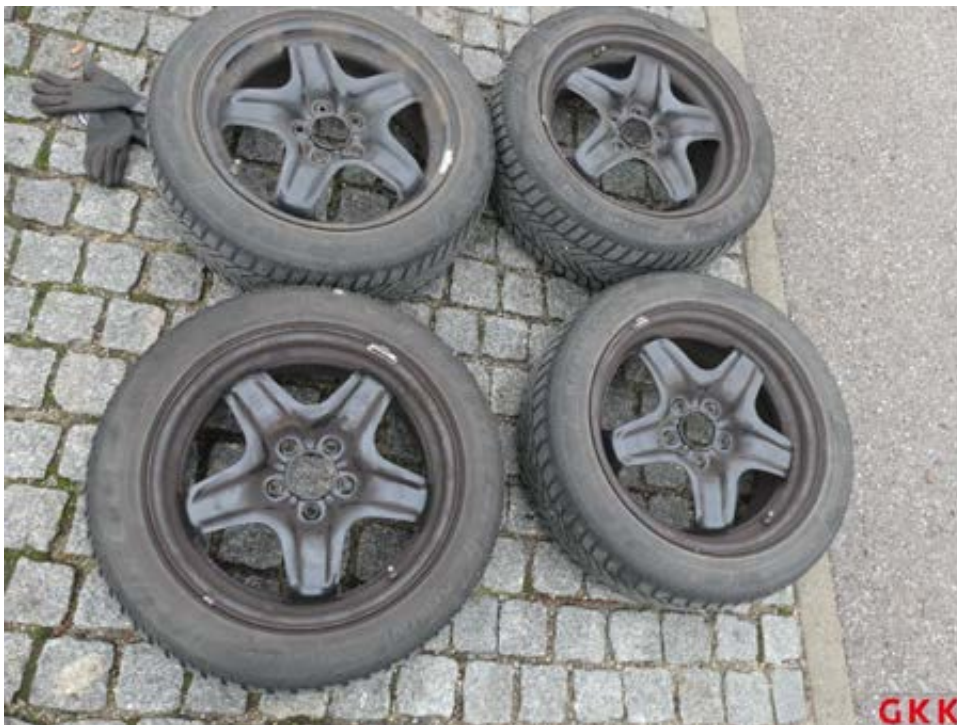
Bild 40 beiliegender Radsatz