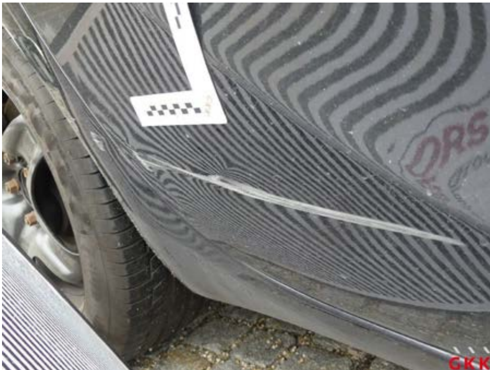
Bild 28 Tür hinten rechts, beschädigt, instand setzen - lackieren