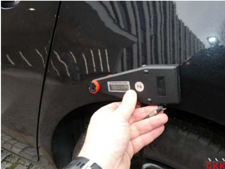
Bild 25 Seitenwand links, Reparaturmangel, lackieren