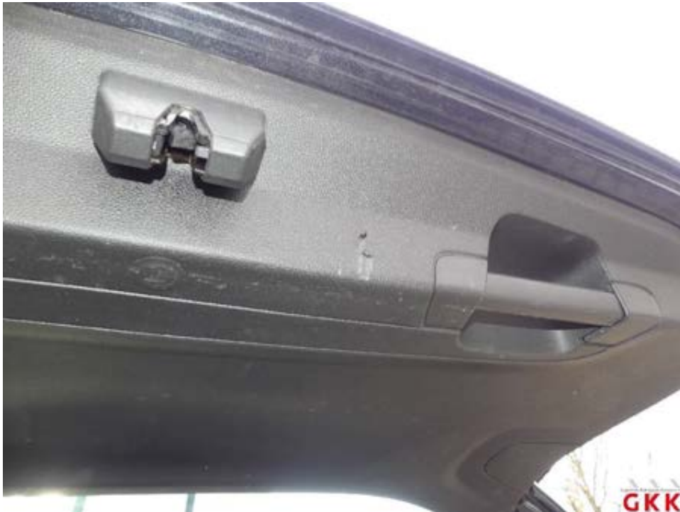
Bild 21 Heckklappe, Innenverkleidung, verkratzt, Smartrepair