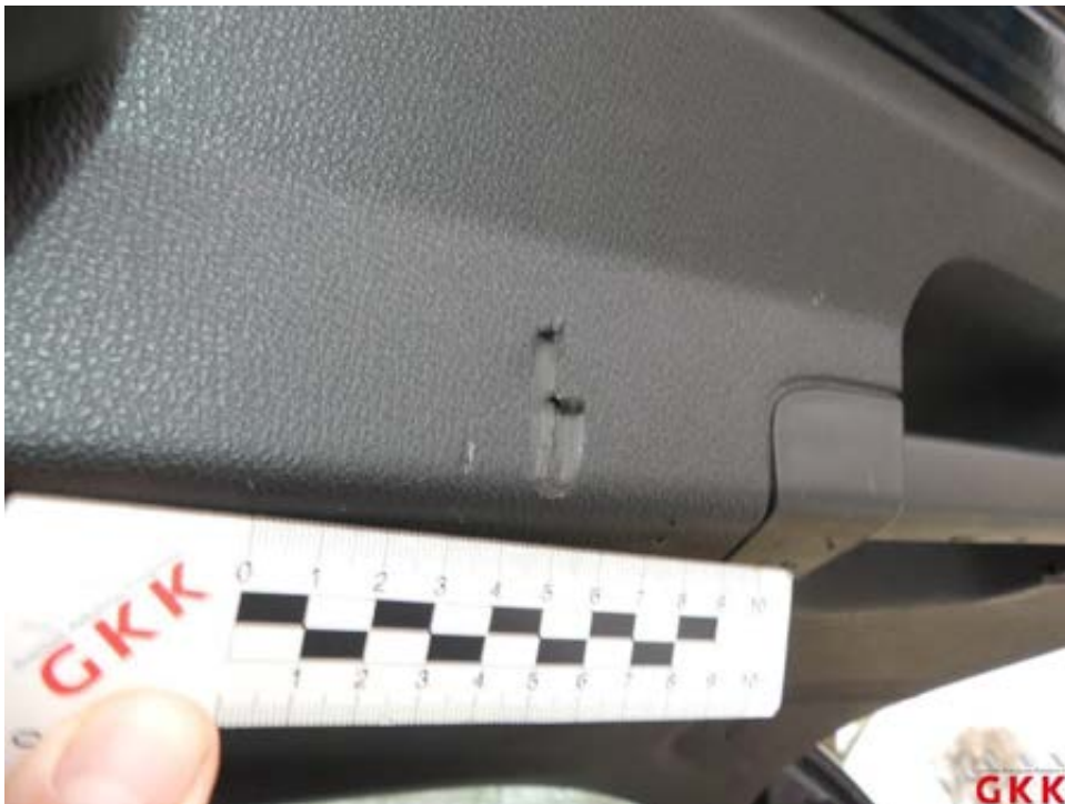
Bild 22 Heckklappe, Innenverkleidung, verkratzt, Smartrepair