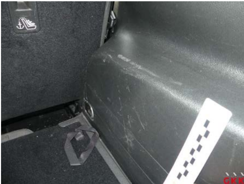
Bild 20 Laderaum, verkratzt, Smartrepair