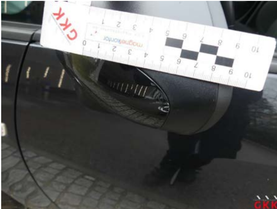
Bild 39 Spiegelgehäuse links, Kappe -lackiert-, verkratzt, auslegen, schleifen, polieren