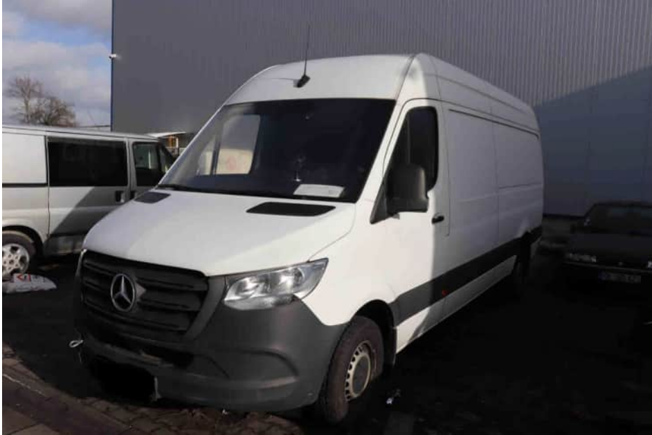
Bild 1 Diagonalansicht vorne links