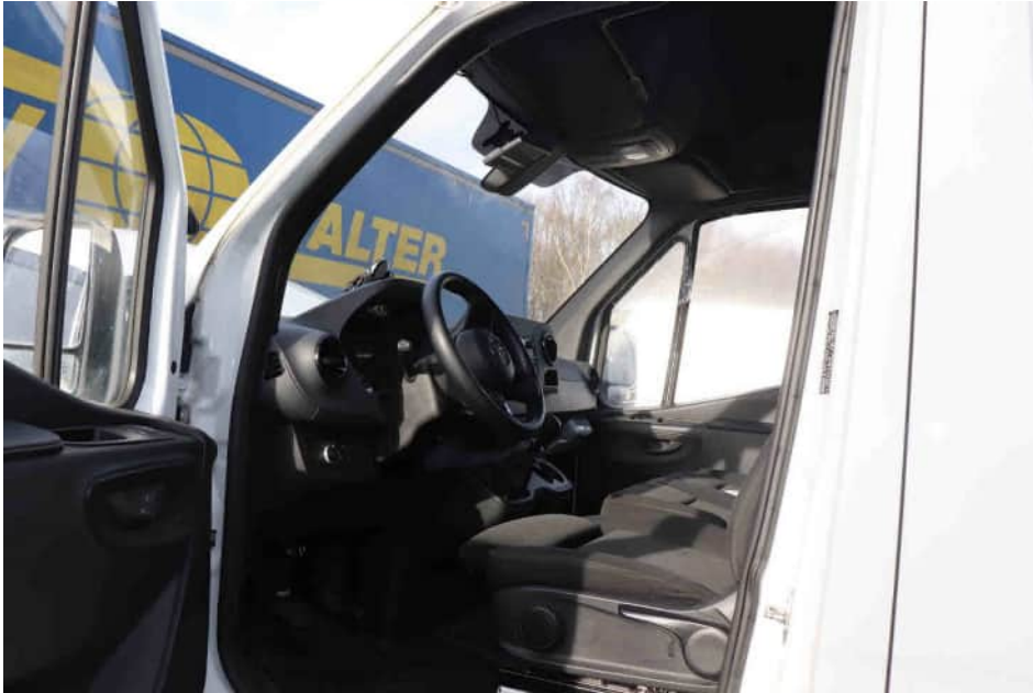
Bild 7 Innenraum