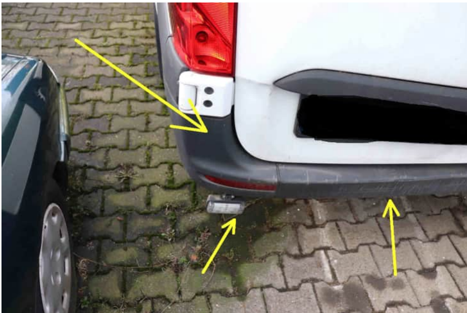
Bild 20 Heckverkleidung angestoßen