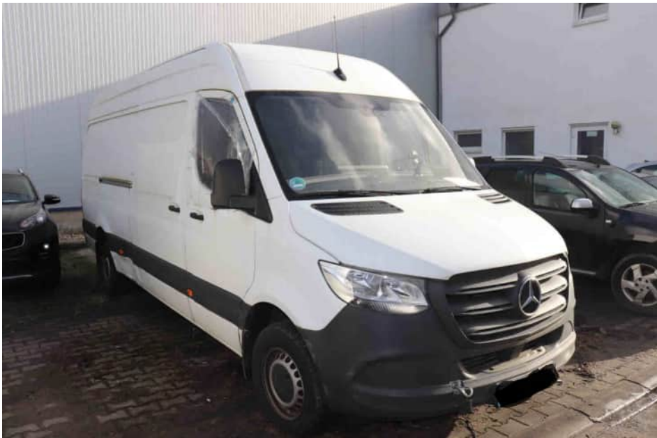
Bild 2 Diagonalansicht vorne rechts