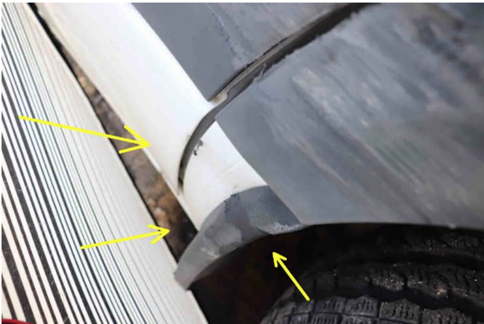
Bild 26 Beschädigung des Radlauf vorne rechts