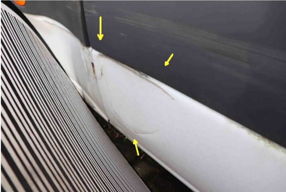
Bild 29 Verformung der Schiebetür rechts