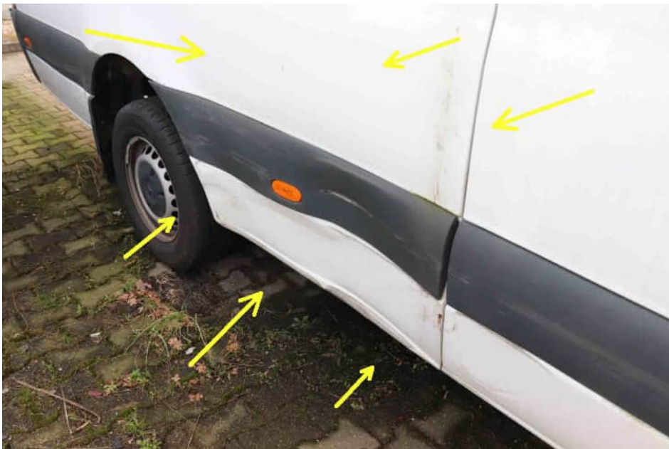
Bild 30 Verformung der Seitenwand rechts