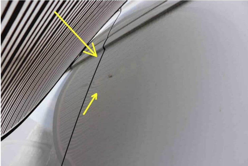
Bild 23 Verformung der Seitenwand links mittig