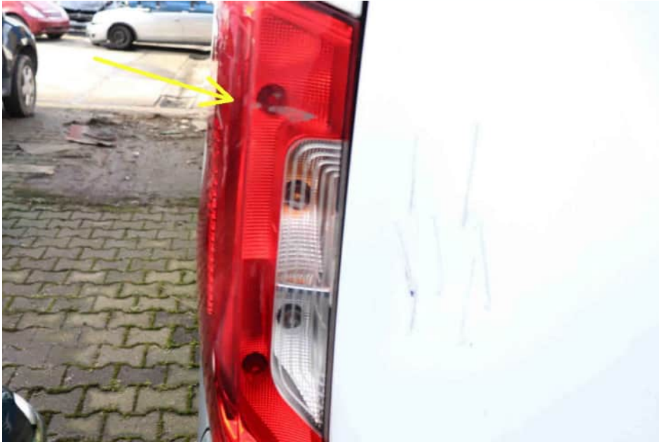
Bild 19 Beschädigung der Rückleuchte links