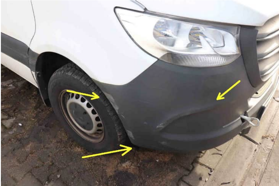
Bild 25 Beschädigung der Frontverkleidung rechts