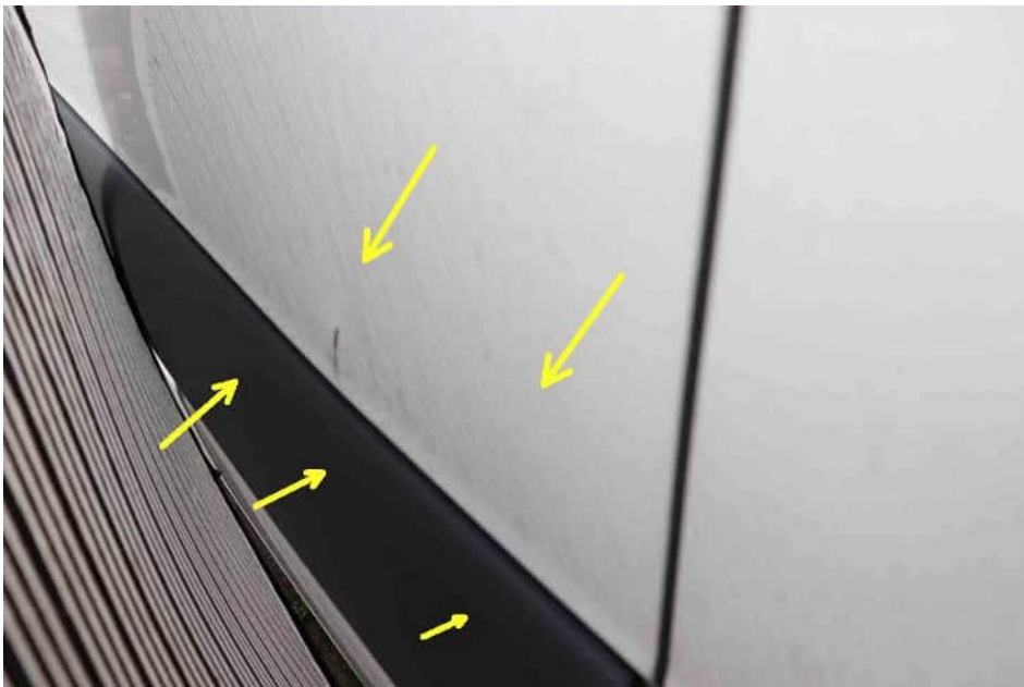
Bild 22 Verformung der Seitenwand links mittig