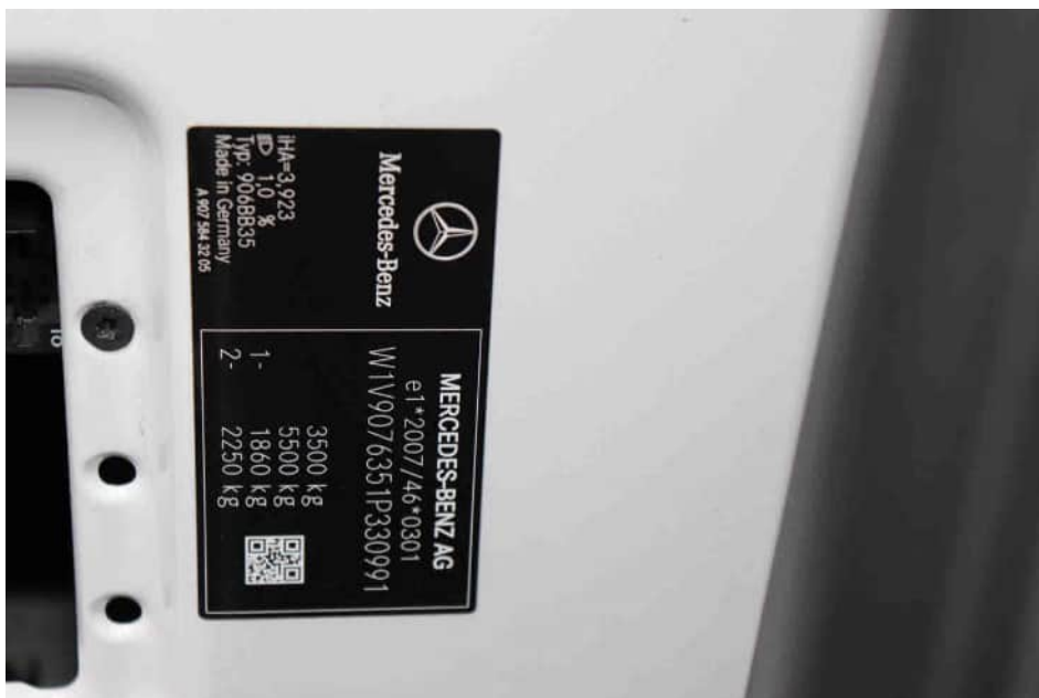
Bild 12 Typenschild