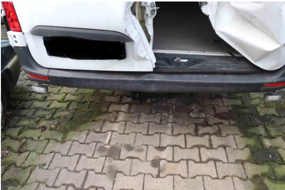
Bild 16 Beschädigung der Hecktür rechts