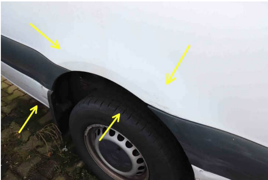
Bild 32 Verformung der Seitenwand rechts