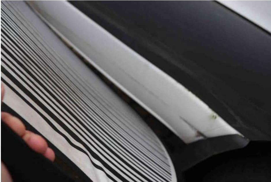
Bild 33 Verformung der Seitenwand rechts