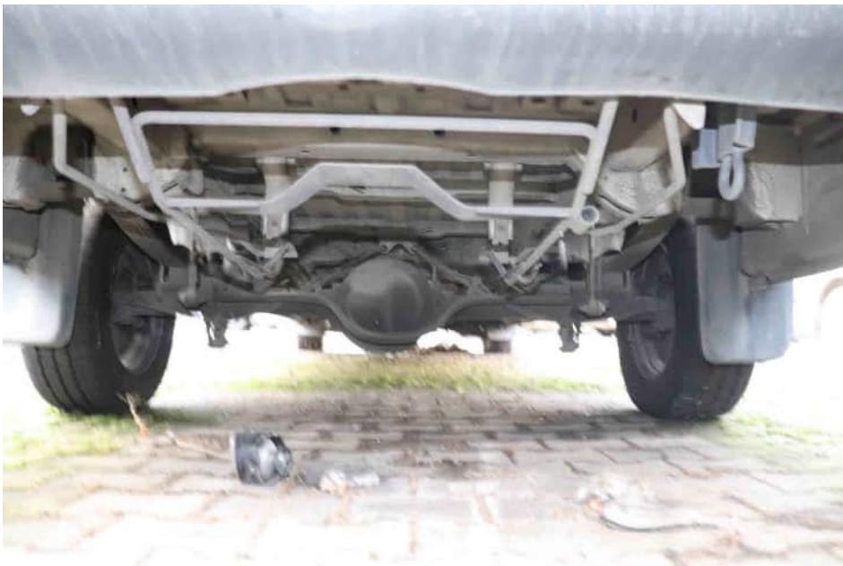
Bild 8 Unterboden von hinten