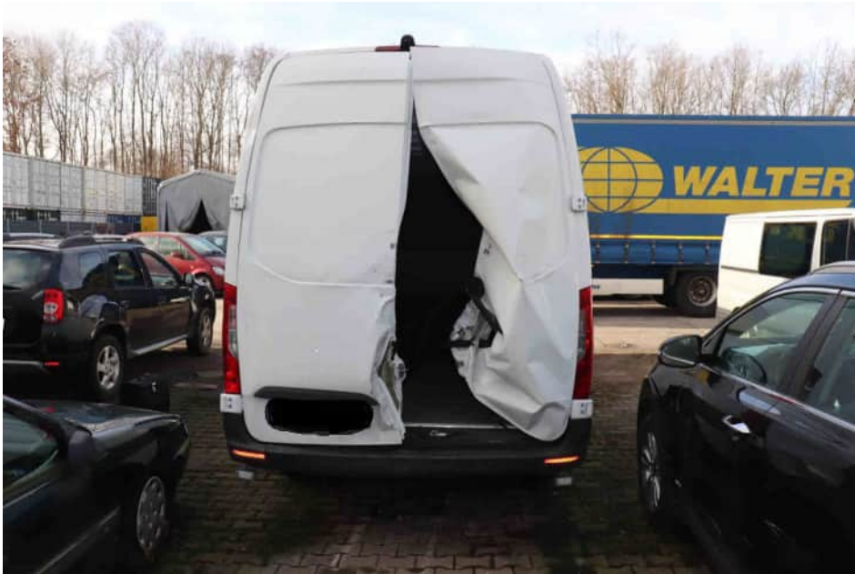
Bild 5 Heckansicht