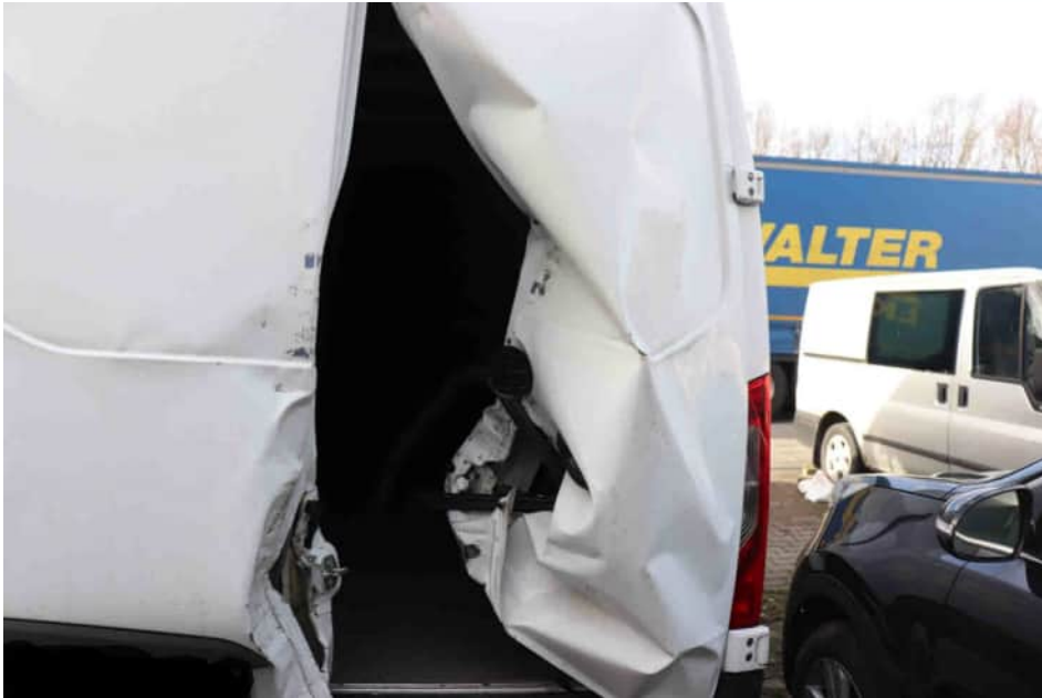
Bild 15 Beschädigung der Hecktür rechts