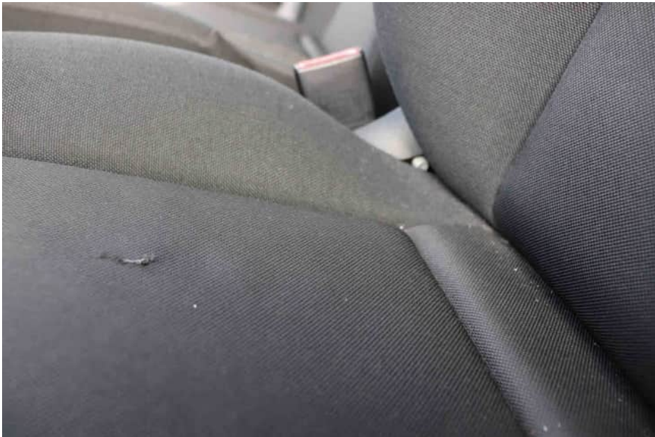
Bild 36 Beschädigung der Sitzfläche links