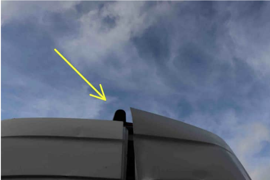
Bild 11 Rückfahrkamera