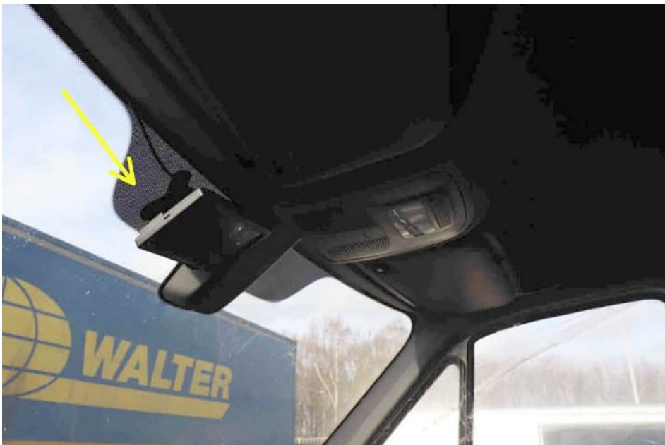
Bild 10 Bildschirm der Rückfahrkamera