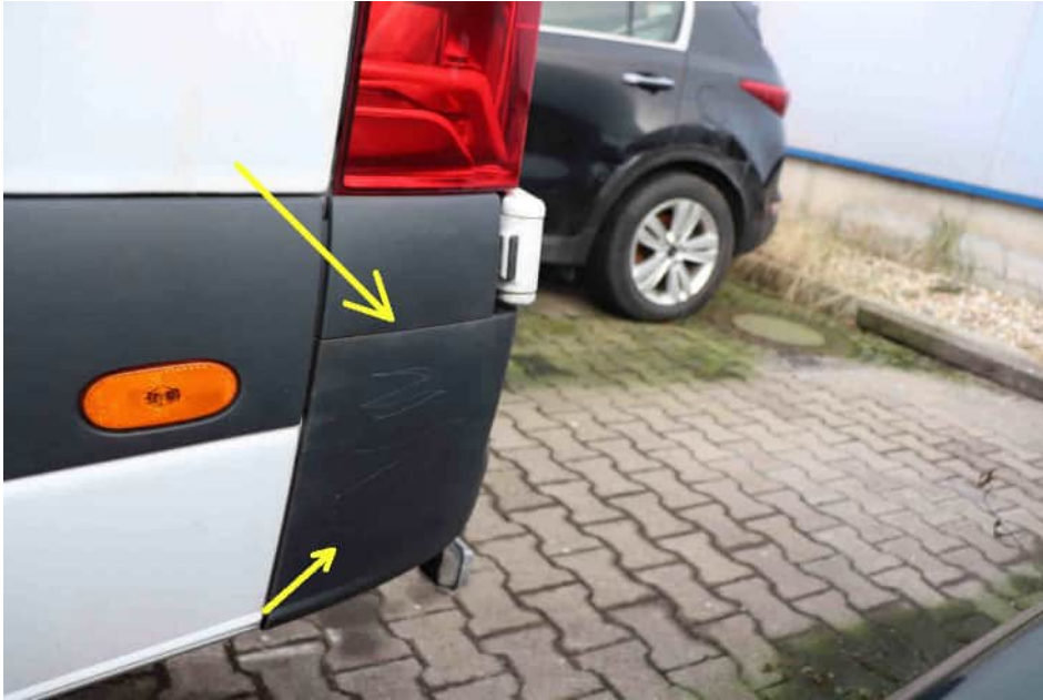
Bild 21 Beschädigung an der Heckverkleidung links