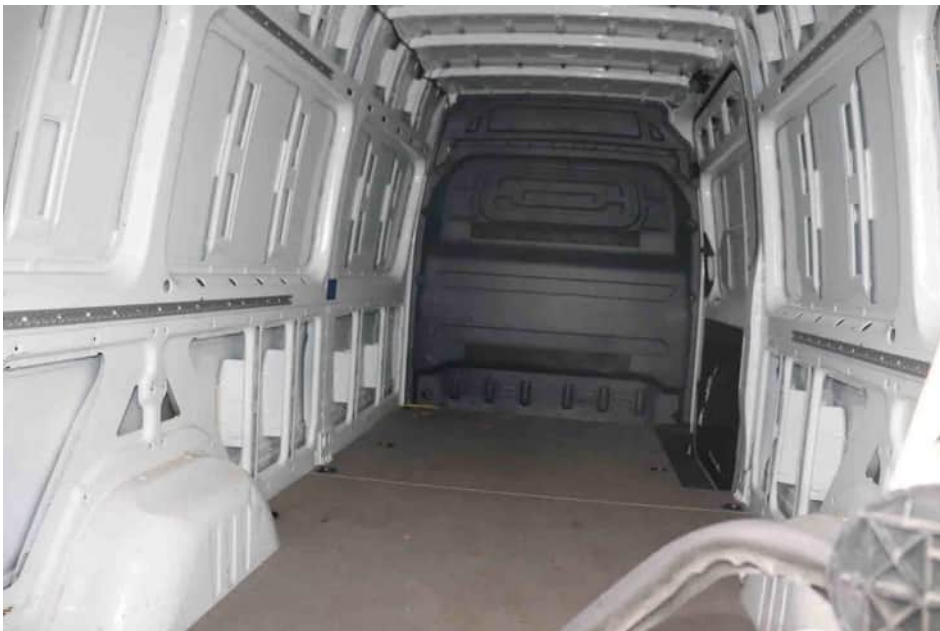
Bild 6 Laderraum