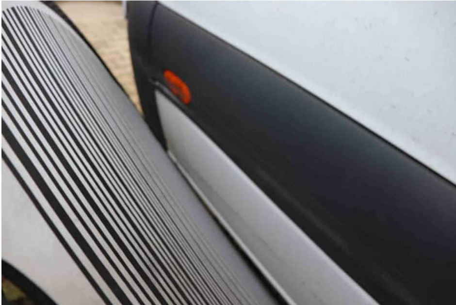
Bild 31 Verformung der Seitenwand rechts