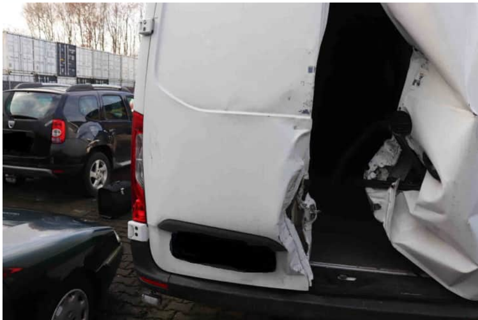
Bild 14 Beschädigung der Hecktür links