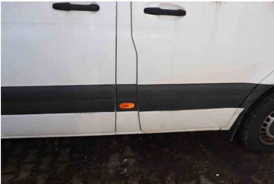
Bild 34 Beschädigung der Zierleisten rechts