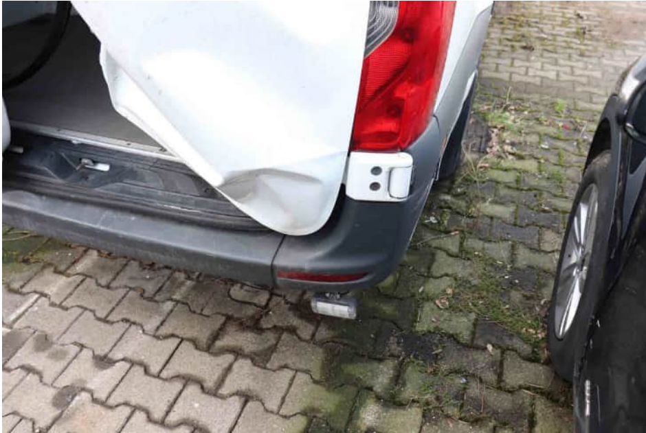
Bild 17 Beschädigung der Hecktür rechts