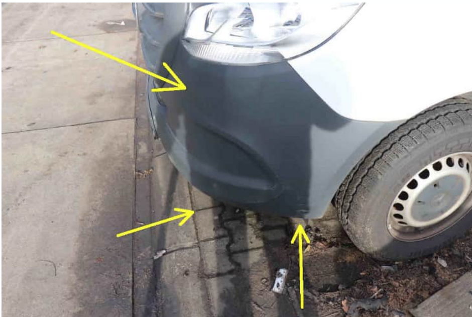
Bild 24 Beschädigung der Frontverkleidung links