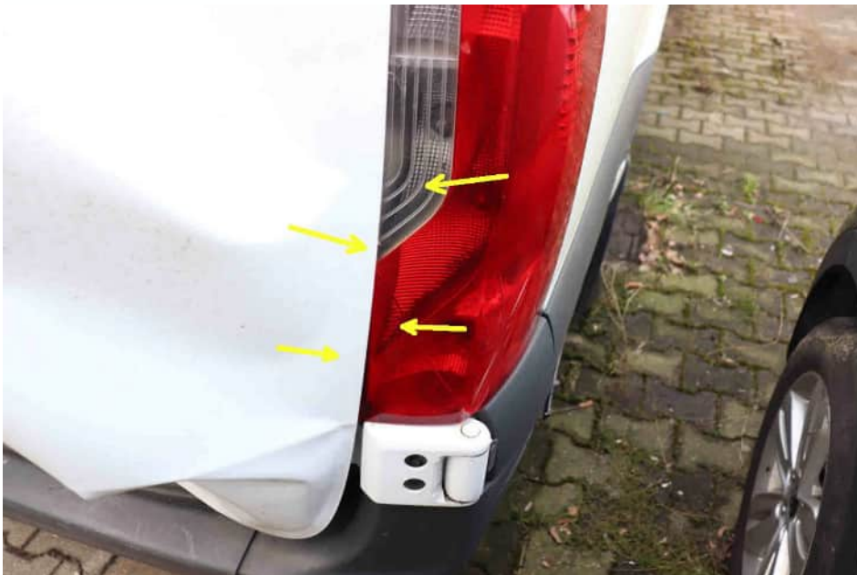
Bild 18 Beschädigung der Rückleuchte rechts