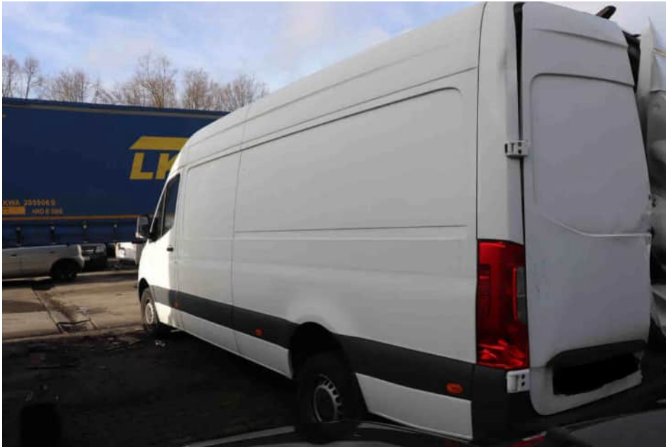
Bild 3 Diagonalansicht hinten links Verformung der Seitenwand mittig links