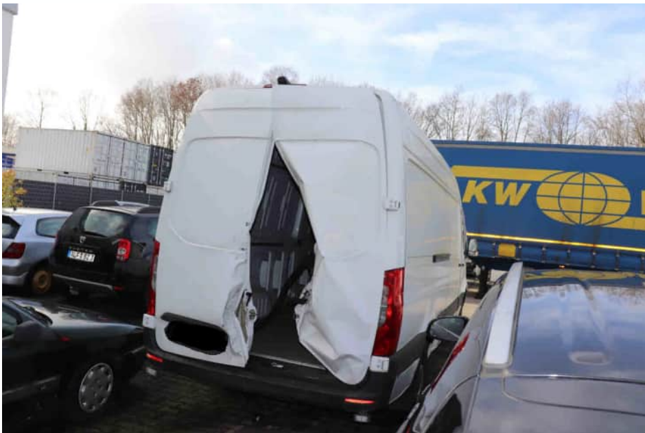
Bild 4 Diagonalansicht hinten rechts