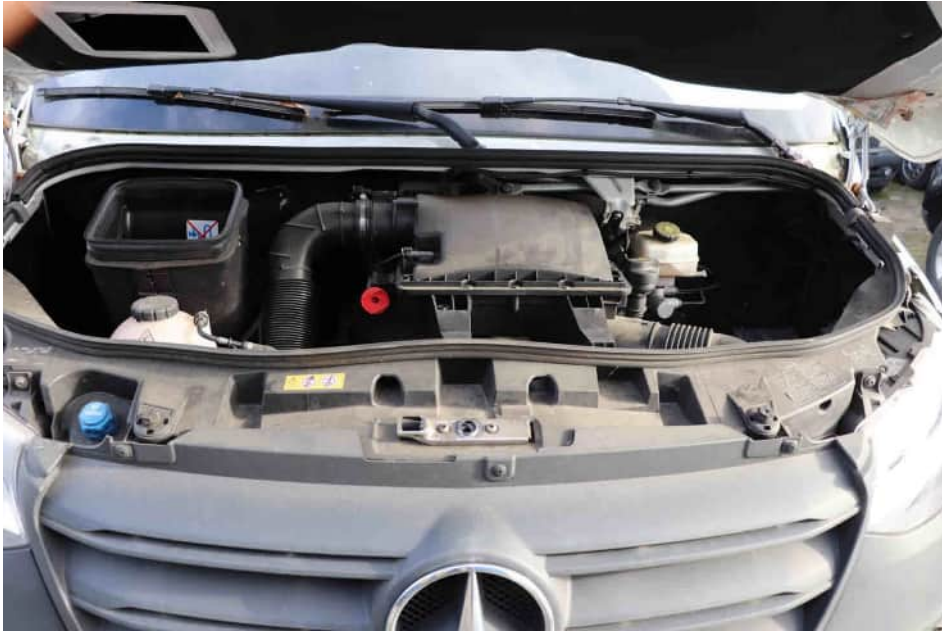
Bild 9 Motorraum