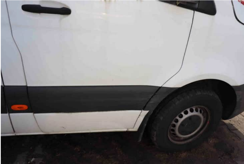
Bild 35 Beschädigung der Zierleisten rechts