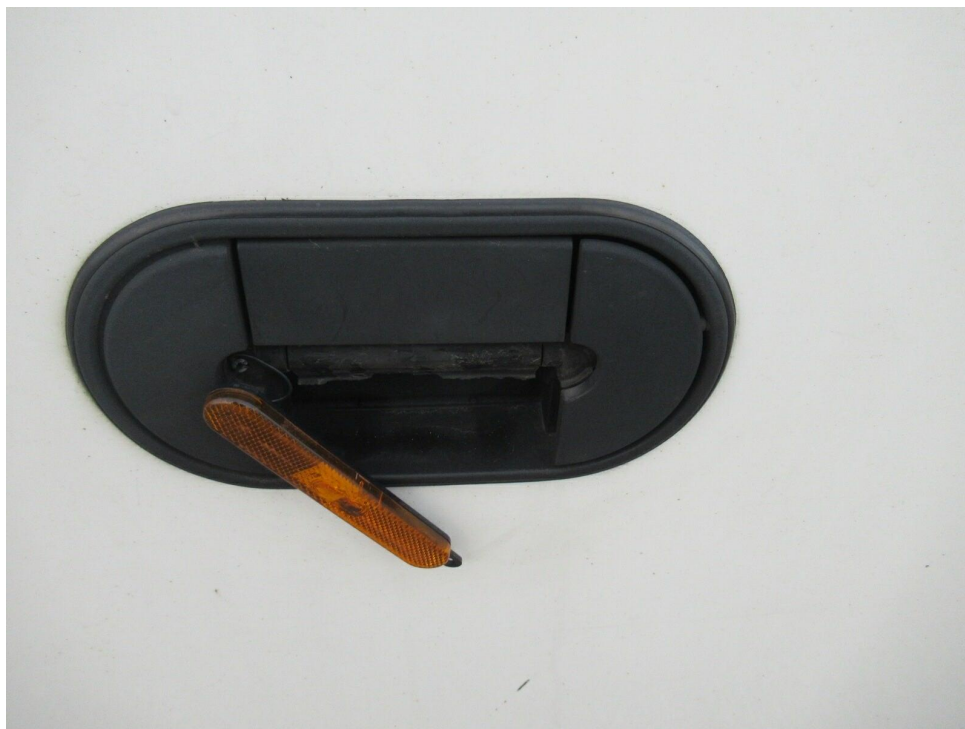
Bild 15 : Begrenzungsleuchte/ Griff Stauraumklappe links vorne abgebrochen