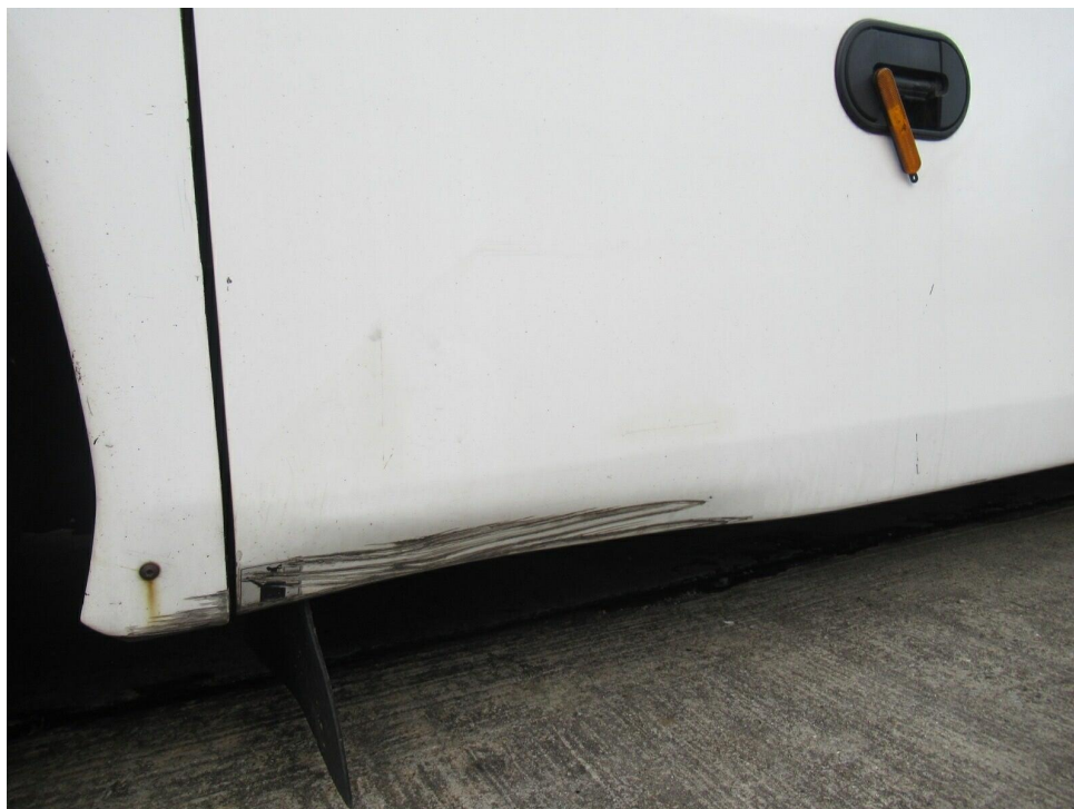
Bild 16 : Stauraumklappe links vorne verschrammt und deformiert Radlaufabdeckung A-Achse links verschrammt und deformiert