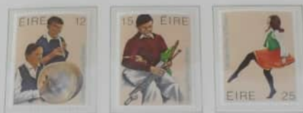
Irland Irische Musik und Tanz.

Auf der 'grünen' Insel am Rande Europas gibt es viele Traditionen und Künste, die sich in langer Isolation und in der Abgeschlossenheit des Landlebens ungebrochen entfaltet und erhalten haben. Oftmals wird keltisches Erbe deutlich, wie bei der urtümlichen Volksmusik, mit der die Iren, wie zeitgenössische Reisende berichteten, schon im 12. Jahrhundert ihre Gäste unterhielten. Und wer heute aufgeschlossen für Land und Leute durch Irland reist, der wird vielleicht zu einem 'tinging' eingeladen und lernt dort die alten Volkslätze und Weisen unverfälscht kennen. Typisch irische Musikinstrumente und eine Volks tänzerin zeigen die drei irischen Briefmarken. Bodhran, ähnlich wie ein Tamburin, Flöte und Dodelack gehören zu den charakteristischen Instrumenten irischer Volkstanzgruppen. In Kostümen mit reicher Stickerei werden die Tänze vorgeführt, meist eine Weiterentwicklung traditioneller Volkstänze, die bei gesellschaftlichen Ereignissen auf dem Lande im 18. und 19. Jahrhundert eine wichtige Rolle spielten.