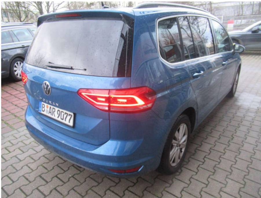
Übersichtsbild hinten rechts