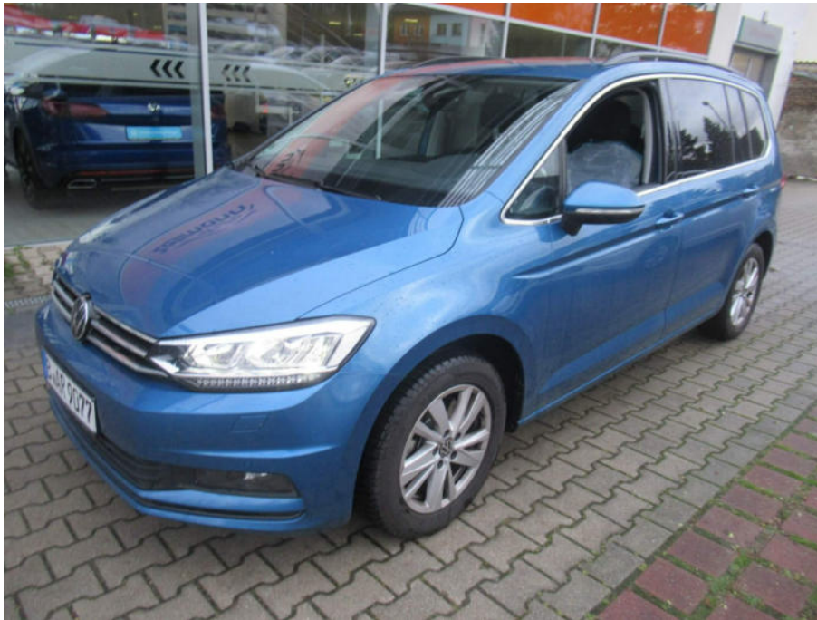
Übersichtsbild vorne links