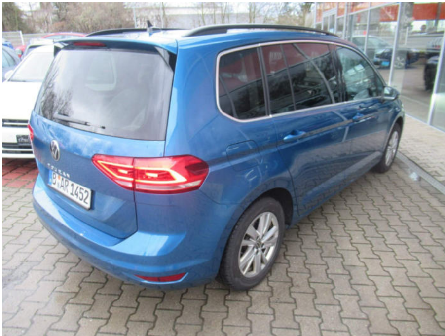
Übersichtsbild hinten rechts