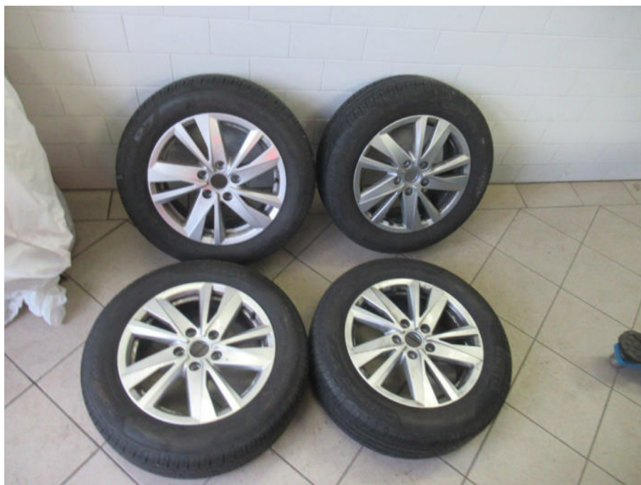
Zusätzlicher Radsatz Sommer