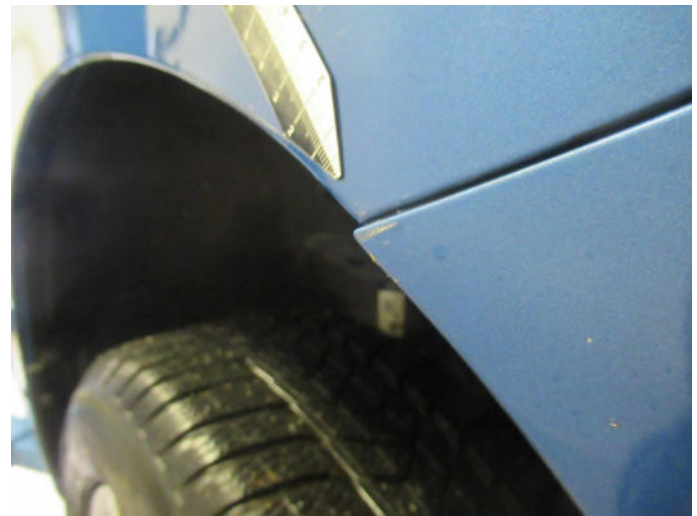
Bild 2: Außen, Fahrzeug - Streifschaden vorn rechts, deformiert, instandsetzen