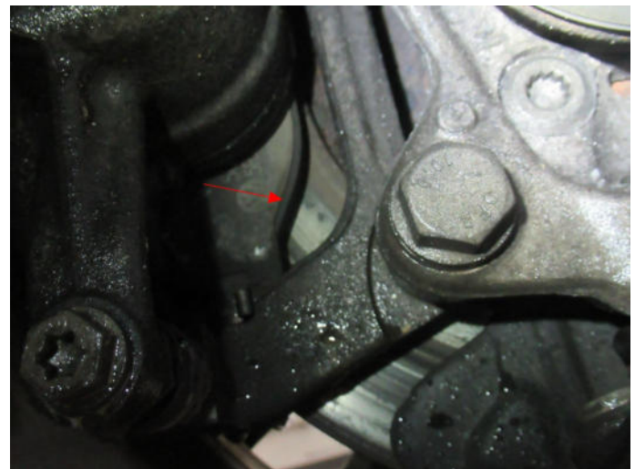
Bild 4: Technik, Bremse vorne - Scheiben, Tragbild beachten, Gebrauchsspur