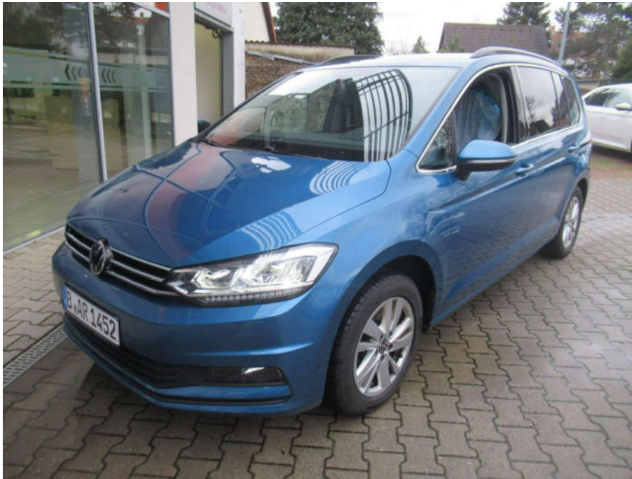
Übersichtsbild vorne links