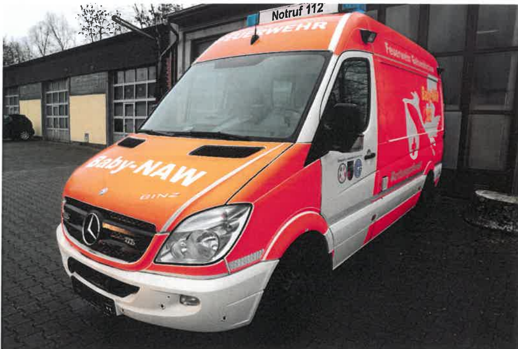
Übersichtsaufnahme von vorne links