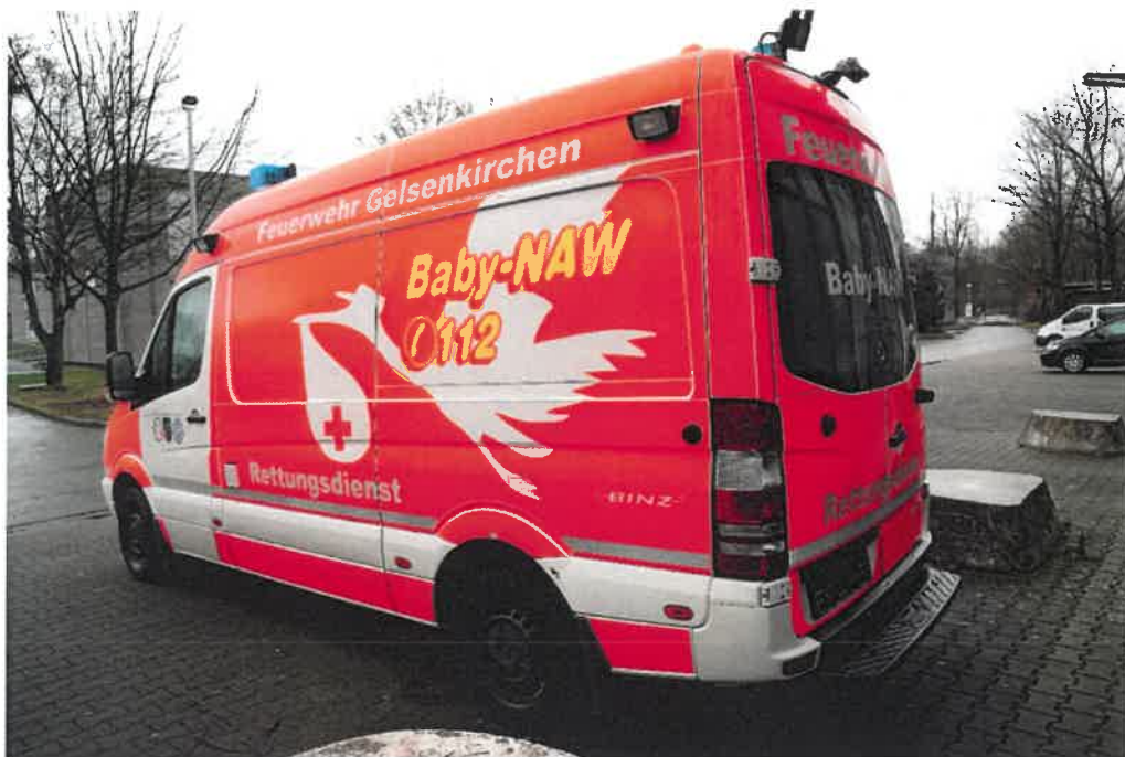
Übersichtsaufnahme von hinten links