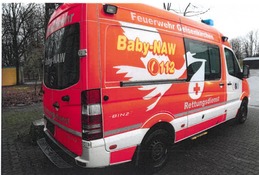
Übersichtsaufnahme von hinten rechts