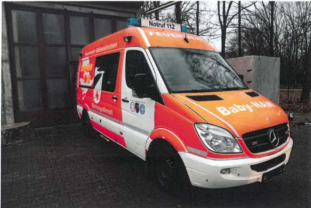
Übersichtsaufnahme von vorne rechts