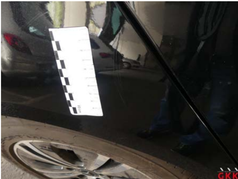
Bild 14 Seitenwand rechts, verkratzt, Smartrepair