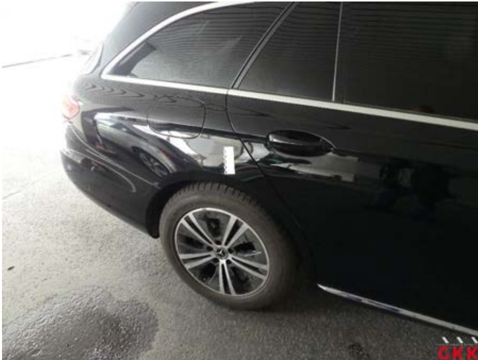
Bild 13 Seitenwand rechts, verkratzt, Smartrepair