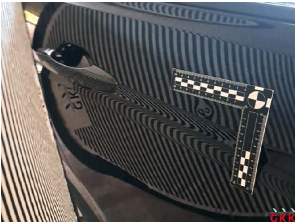
Bild 32 Tür hinten rechts, beschädigt, instand setzen - lackieren