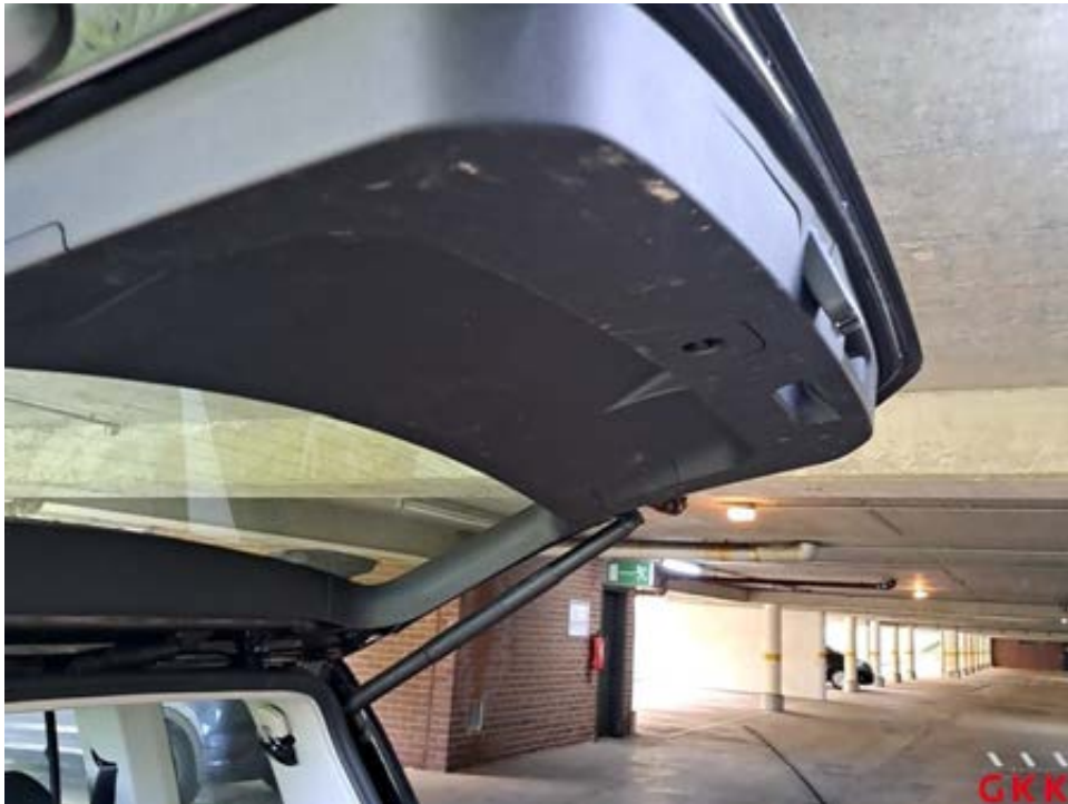
Bild 35 Heckklappe, Innenverkleidung, verkratzt, Smartrepair