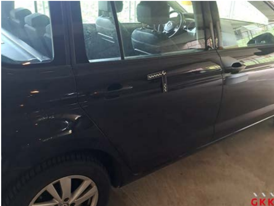
Bild 31 Tür hinten rechts, beschädigt, instand setzen - lackieren