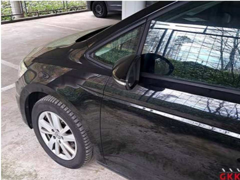
Bild 27 Spiegelgehäuse links, Rahmen, beschädigt, ersetzen