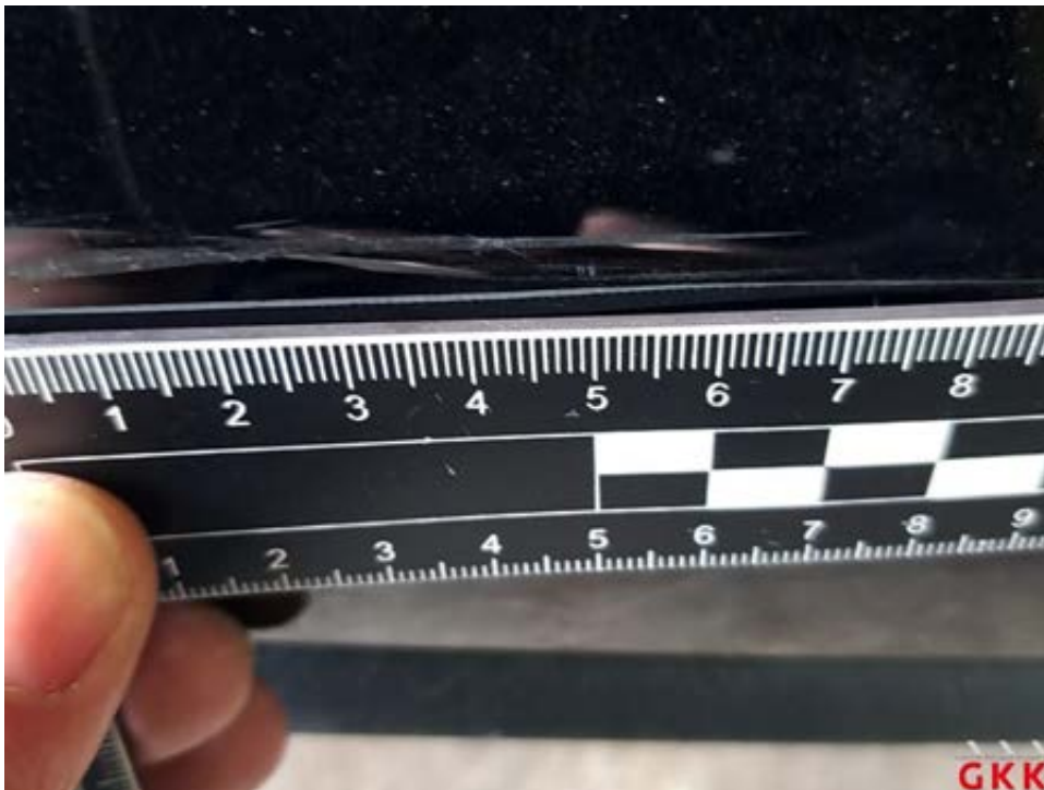
Bild 34 Stoßfänger hinten, Verkleidung -lackiert-, verkratzt, lackieren