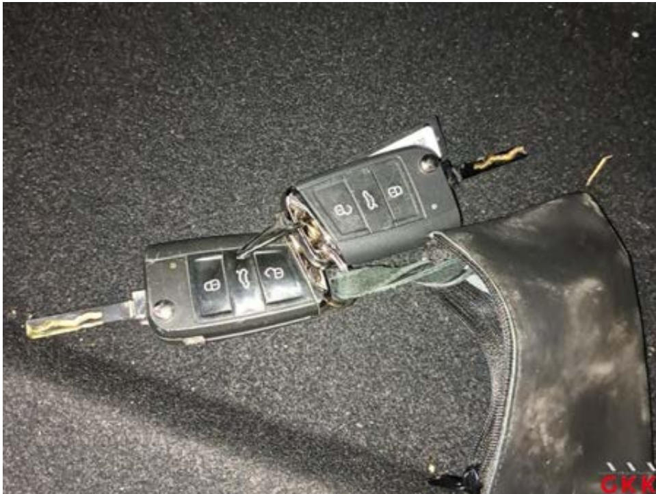
Bild 43 Hauptschlüssel, mit Fernbedienung, beschädigt, ersetzen