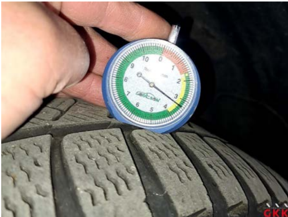
Bild 40 Reifen, vorn links und rechts, Untermaß, ersetzen