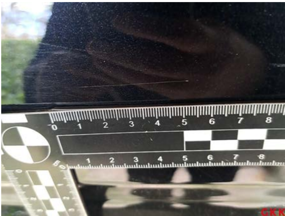
Bild 24 Tür hinten links, verkratzt, lackieren