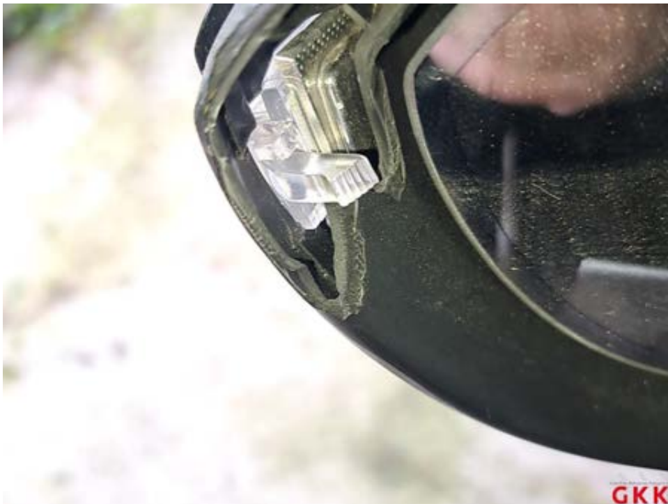
Bild 28 Spiegelgehäuse links, Rahmen, beschädigt, ersetzen