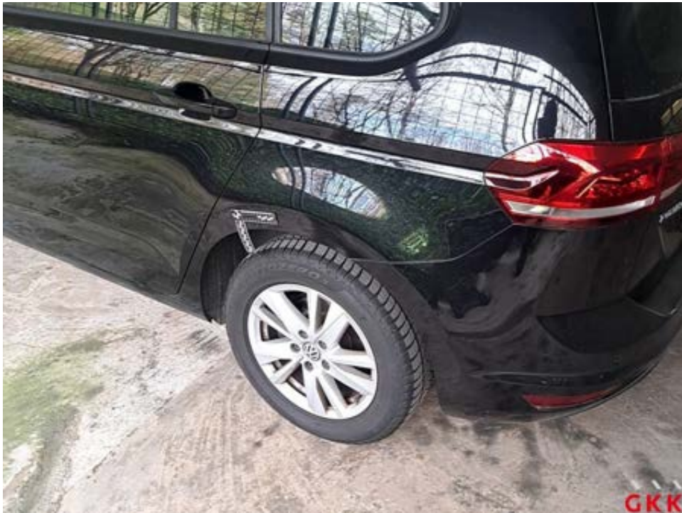
Bild 19 Seitenwand links, verkratzt, lackieren