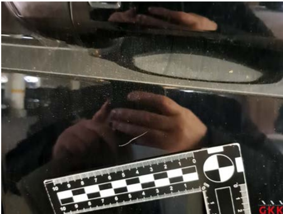
Bild 30 Tür vorne rechts, verkratzt, lackieren