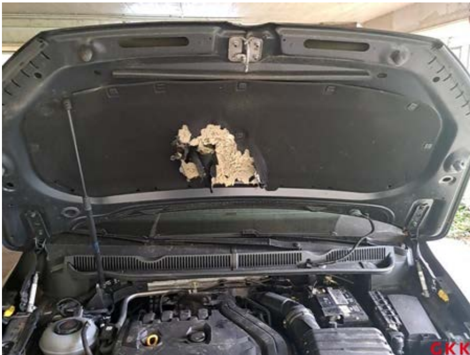
Bild 18 Motorhaube, Dämmmatte, beschädigt, ersetzen