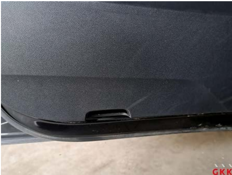
Bild 42 Tür vorne links, Innenverkleidung -Leuchte/Reflektor-, fehlt, ersetzen