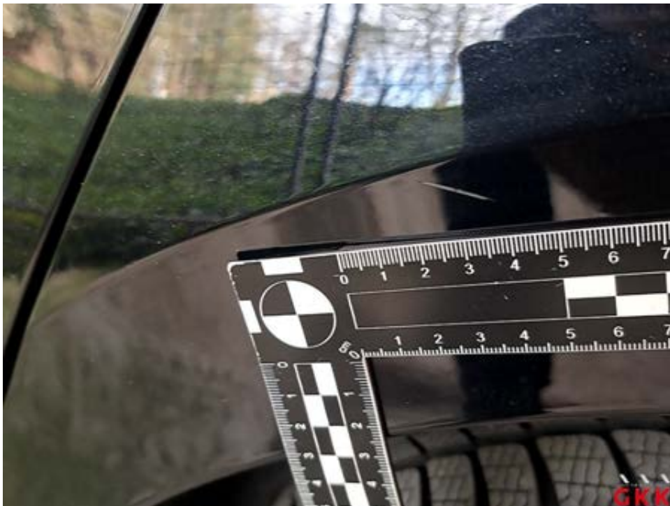
Bild 20 Seitenwand links, verkratzt, lackieren