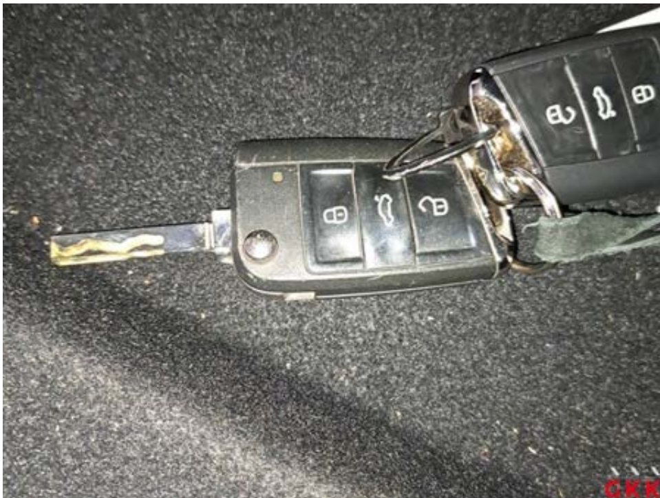
Bild 44 Hauptschlüssel, mit Fernbedienung, beschädigt, ersetzen