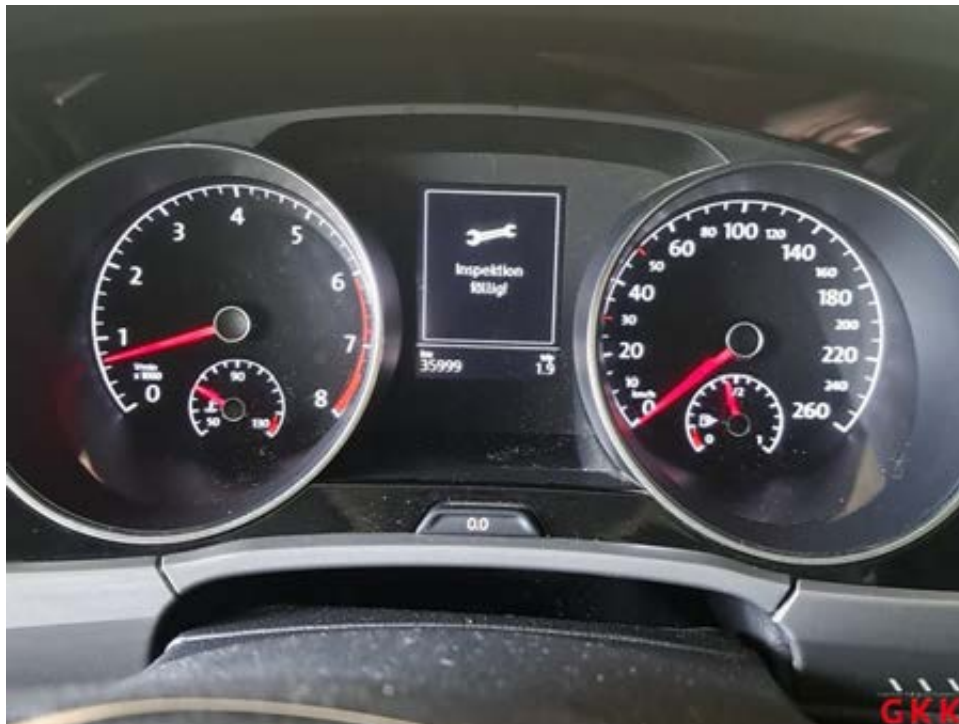
Bild 16 Inspektion klein, Mittelklasse, fällig, durchführen