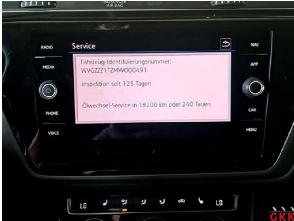
Bild 15 Inspektion klein, Mittelklasse, fällig, durchführen