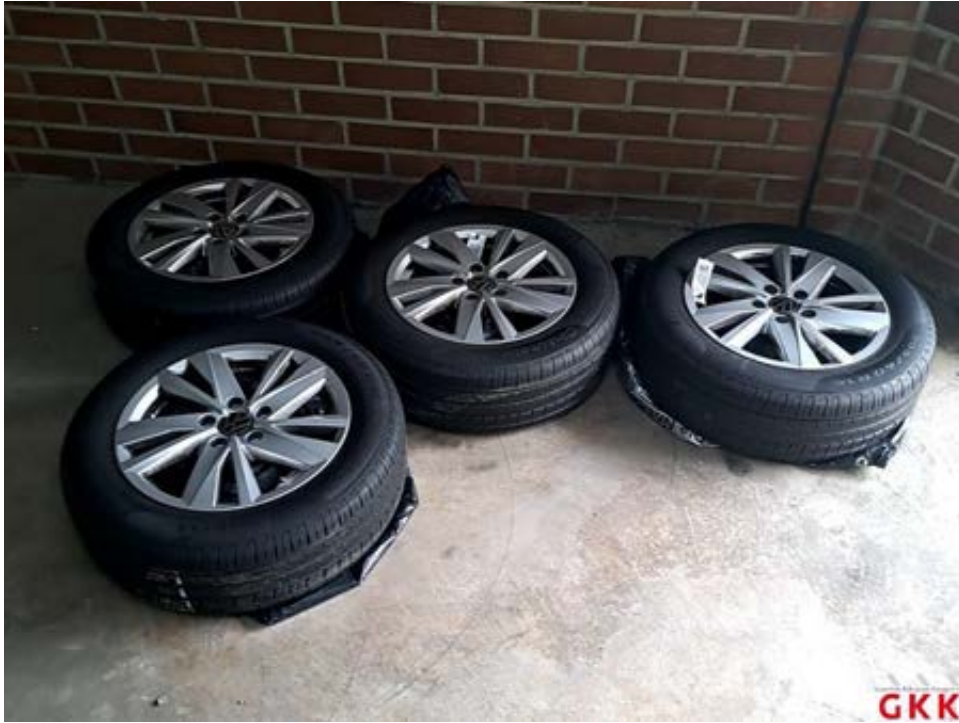
Bild 45 beiliegender Radsatz