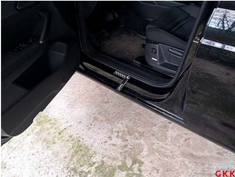
Bild 25 Tür vorne links, Einstieg, verkratzt, Smartrepair