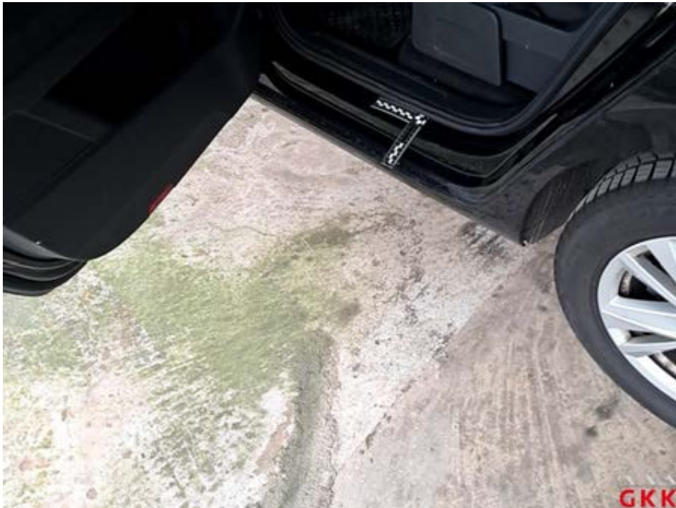
Bild 21 Tür hinten links, Einstieg, verkratzt, Smartrepair