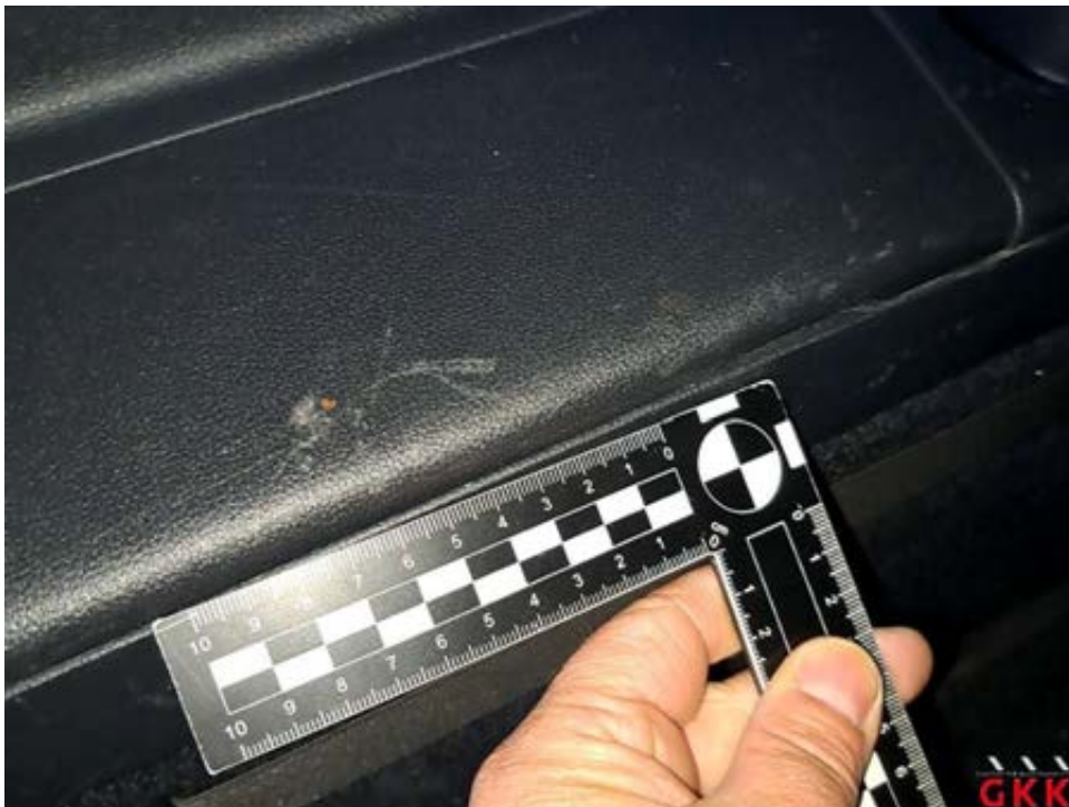
Bild 38 Seitenwand links, Innenverkleidung, verkratzt, Smartrepair