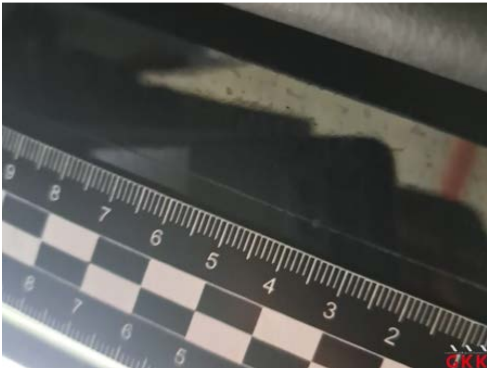
Bild 22 Tür hinten links, Einstieg, verkratzt, Smartrepair