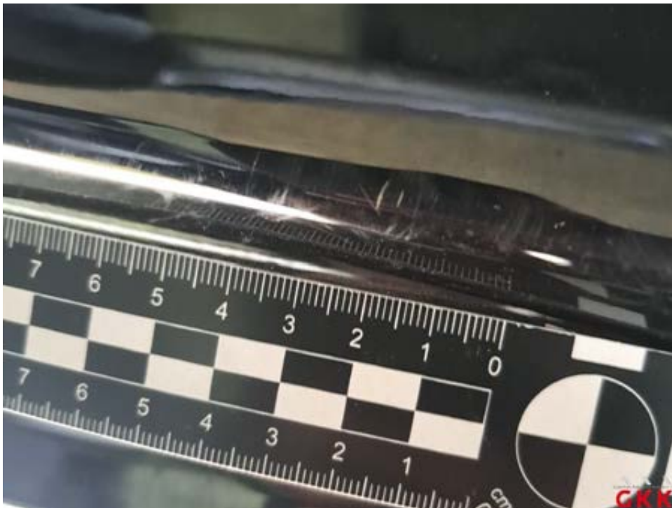
Bild 26 Tür vorne links, Einstieg, verkratzt, Smartrepair