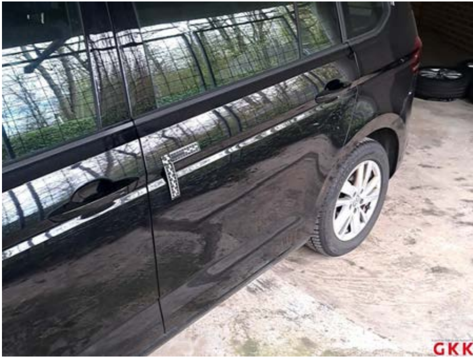
Bild 23 Tür hinten links, verkratzt, lackieren