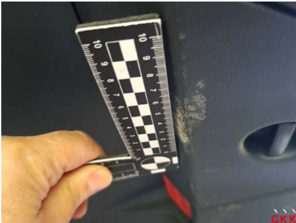
Bild 36 Heckklappe, Innenverkleidung, verkratzt, Smartrepair