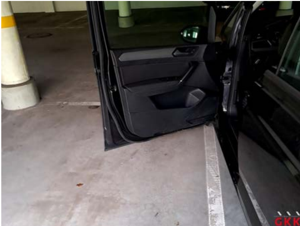
Bild 41 Tür vorne links, Innenverkleidung -Leuchte/Reflektor-, fehlt, ersetzen