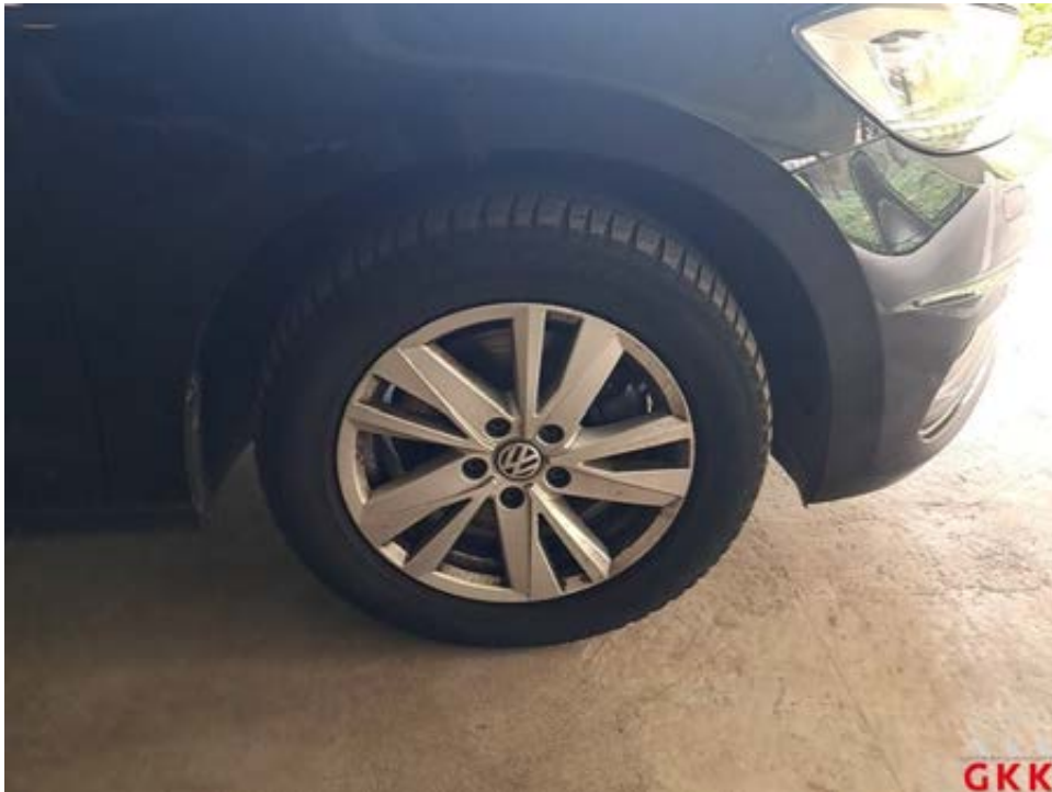
Bild 39 Reifen, vorn links und rechts, Untermaß, ersetzen