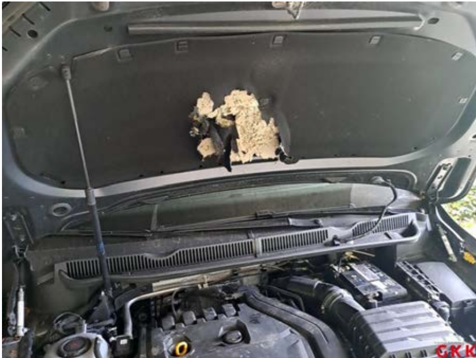
Bild 17 Motorhaube, Dämmmatte, beschädigt, ersetzen