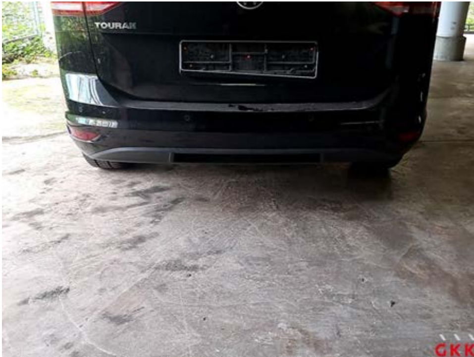
Bild 33 Stoßfänger hinten, Verkleidung -lackiert-, verkratzt, lackieren