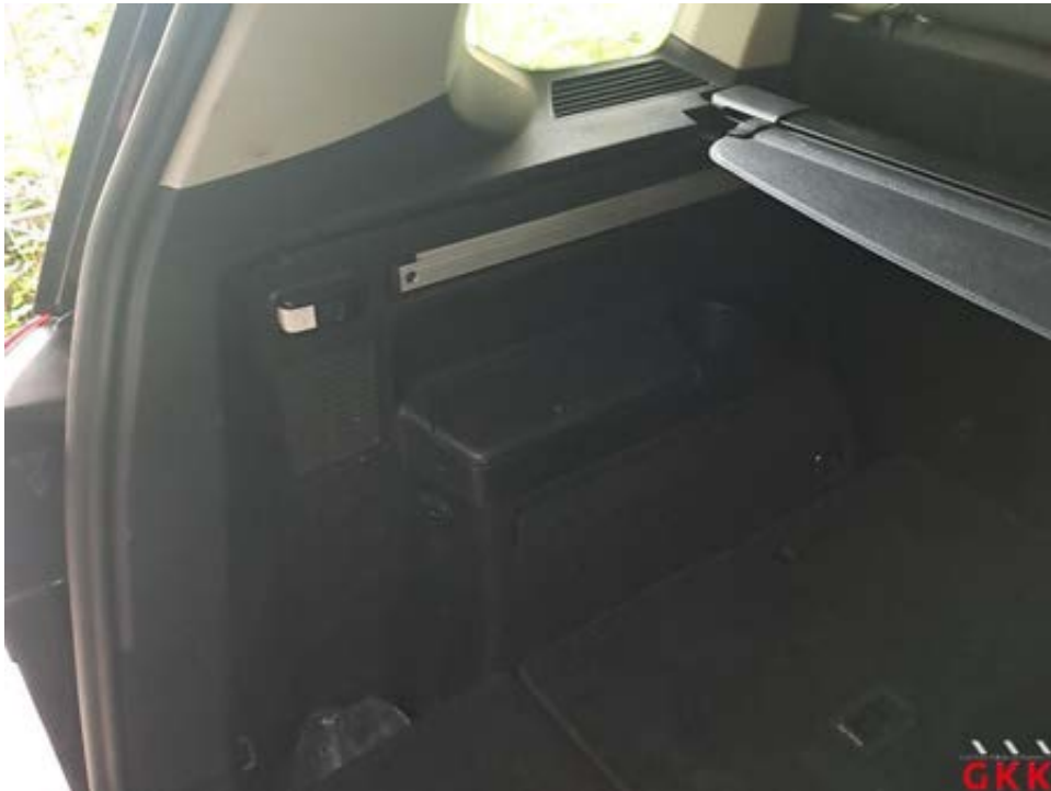
Bild 37 Seitenwand links, Innenverkleidung, verkratzt, Smartrepair