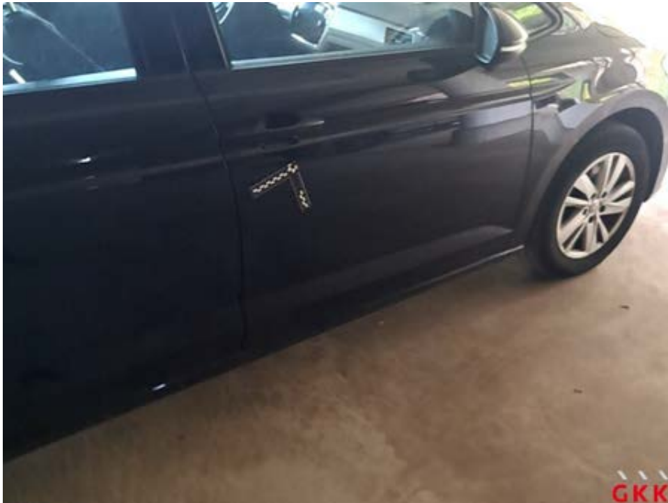
Bild 29 Tür vorne rechts, verkratzt, lackieren